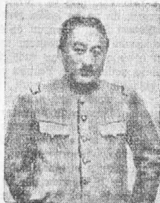
Doihara, neugnani pobornik japonskega vohunstva.

ki mu je pri poslednjih dogodkih poverjena posebna vloga. Podrejen mu ni samo oddelek »Črnega zmaja« za Kitajsko, ampak še važnejša vloga v vročem obmejnem ozemlju, odkoder izhaja glavno delovanje proti Sovjetski zvezi. Delo tega kluba pa se po njegovem načelnem načrtu razteza tudi na Indijo, japonske agente so zasačili celo v Palestini, kamor so prišli od Perzijskega zaliva. »Črni zmaj« je imel zelo veliko agentov tudi v Abesiniji in ob Rdečem morju, posebno še med italijansko-abesinsko vojno.