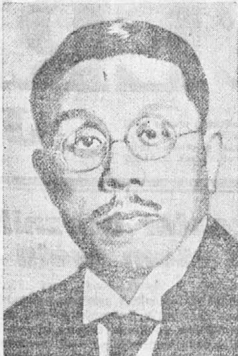
Hirota, ki ima tudi svojo besedo pri »Črnem zmaju«.

Leta 1934 je šanghajski list, ki ga združujejo Amerikanci — vse časnike v Šanghaju plačujejo posamezne države, ki so tam zainteresirane, zasebnih časniških lastnikov pa tam sploh ni — prinesel vest, da je bil današnji japonski ministrski predsednik Hirota član »Črnega zmaja«. List je hotel s to vestjo škodovati ugledu napadenega odličnika. Hirota pa tega niti najmanj ni smatral za sramoto, ampak je mirno priznal, da je tej zvezi zares pripadal. Leta 1904—5 je bil član tega kluba. Člani so bili tudi njegov minister za zunanje zadeve Arita, nedavni moskovski poslanik Ota in poslednji japonski poslanik v Berlinu.