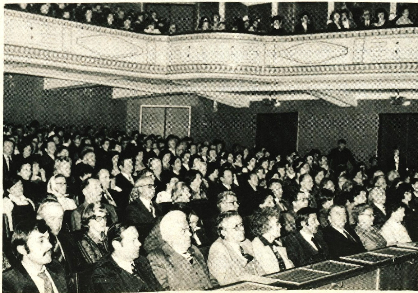
Nedeljski pogled na del dvorane celovškega mestnega gledališča. V ospredju častni gostje prireditve.