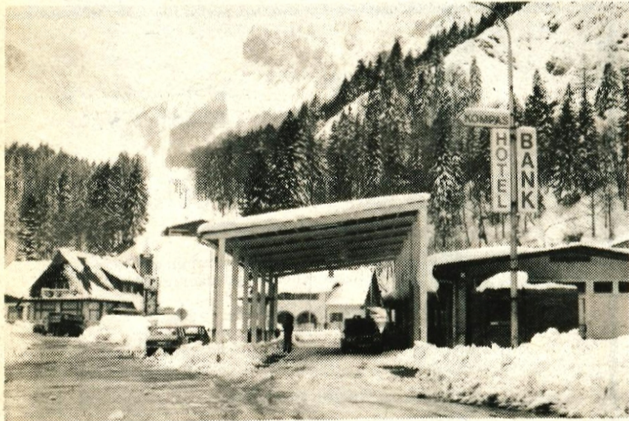
Na Ljubelju kot sredi zime — Čeprav smo sredi aprila, so bile v nedeljo razmere na cesti proti Ljubelju in na samem mejnem prehodu podobne razmeram sredi najhujše zime. Nasulo je toliko snega, da so mu bili stržori Cestnega podjetja iz Kranja komaj kos. Kljub temu sta bila cesta in prehod dopoldne že prevozna. (jk)