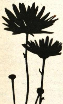
model NERO Barva: sončnica Cena: 574,80 din