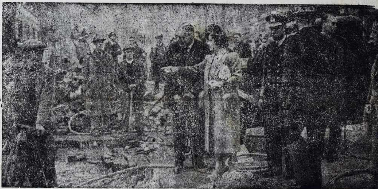
Angleški kralj in kraljica si ogledujeta učinek sovražne bombe.

Kakor hitro se letalec vrne s svojega poleta s fotografijami, ki jih je napravil iz zraka bodisi kot poizvedovalec, bodisi kot napadalec, napravi od vsake tri odtise. Enega dobi poveljstvo generalnega štaba, drugi pride v arhiv, tretjega pa pošljejo v „Fotografični urad generalnega štaba“. Tukaj se fotografija poveča tako, da se more vsak predmet natančno poznati. Posebni strokovnjaki potem študirajo, kakšna škoda je bila napravljena in kolika je ter kakšne vrste je predmet, ki je bil zadet. Potem se napravijo opombe, ki se v več izvodih uredijo in potem popravljajo ali dopolnjujejo.