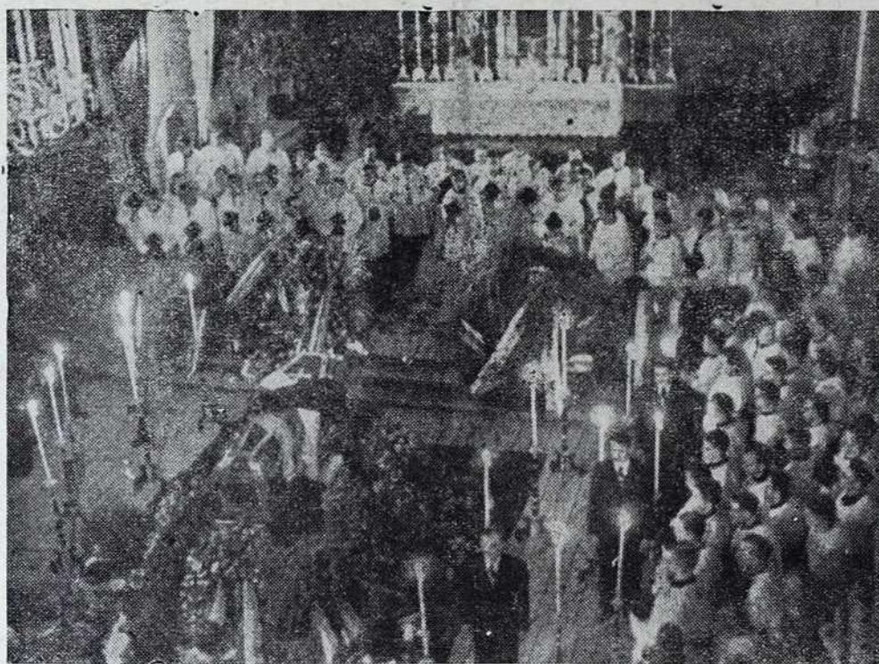
Duhovčina moli v ljubljanski stolnici pred začetkom spreveda

Naročnina „NOVIN“ za I. 1941. na skupni naslov 28 din na posamezni nasl. 36 din