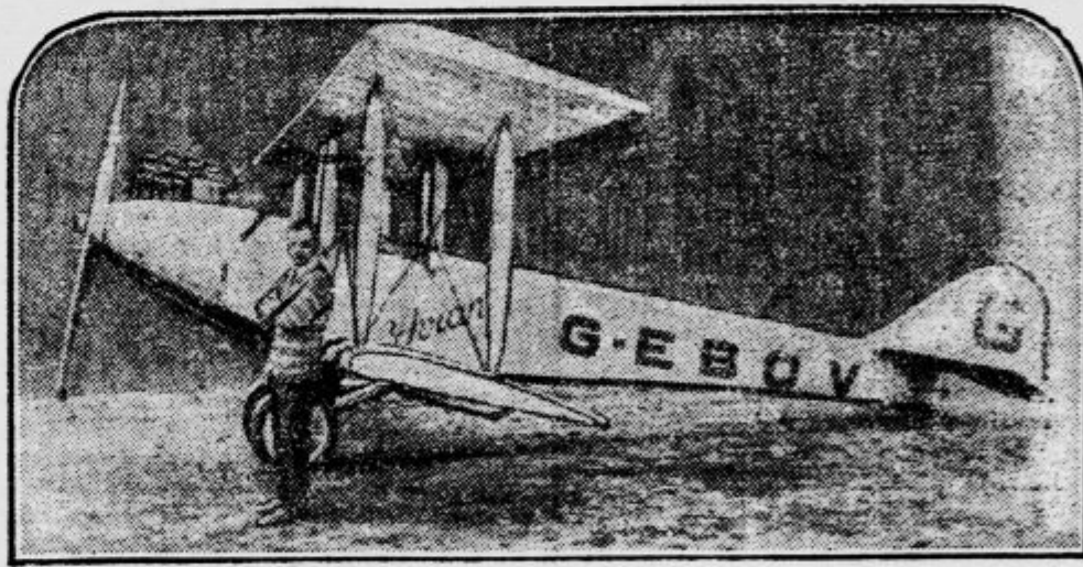
Avstralski letalec Hinckler,