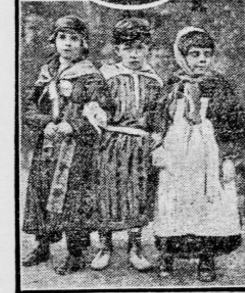
Debeli četrtek v Parizu Vesele skupine pariške deca.