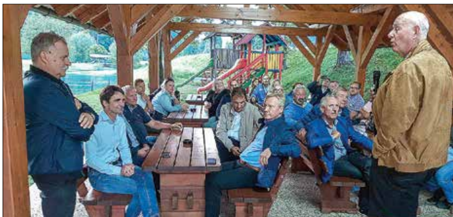
Gostje in gostitelji v sproščenem pogovoru pri ribiškem domu na Ljubnem ob Savinji.

Veliko pozornosti so med delovnim sestankom posvetili sojenju na tekmovanjih in ponovno preverili kriterije sojenja, saj so ti najbolj občutljiv del tekmovanja. To je še zlasti pomembno v sedanjem času, ko se stili skakanja spreminjajo. Ogladali so si številne posnetke skokov iz zadnje smučarske sezone, da bodo kriterije sojenja poenotili in jih prilagodili aktualnemu dogajanju na tekmah.