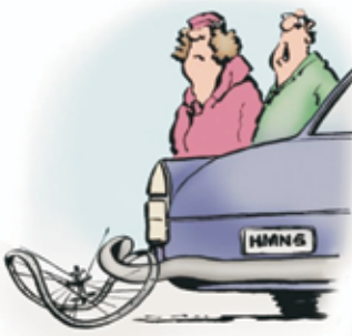
Kaj je kričal tisti kolesar tam zadaj?