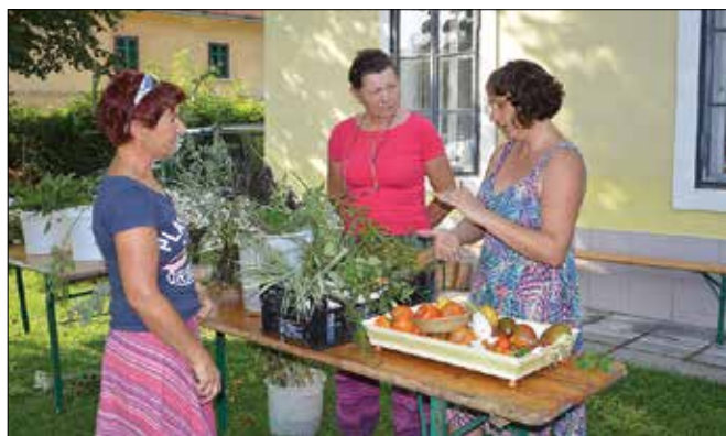
Od ponudnikov so obiskovalci lahko dobili nasvete o gojenju rastlin in zelenjave.

Prinesi – odnesi je akcija, ki jo v Zavodu Stanislava izvajajo od lanskega leta, menjajo se le stvari, ki se izmenjujejo. Ker je sedaj ravno pravi čas za sajenje različnih rastlin in grmovnic, so povabili na stojnice vse, ki imajo viške le-teh in so jih pripravljene zamenjati s kom drugim ali podariti. Kar nekaj obiskovalcev in ponudnikov se je zvrstilo ob stojnici in gomolji, ukoreninjene rastline pa tudi zelenjava so kar hitro menjali lastnike.