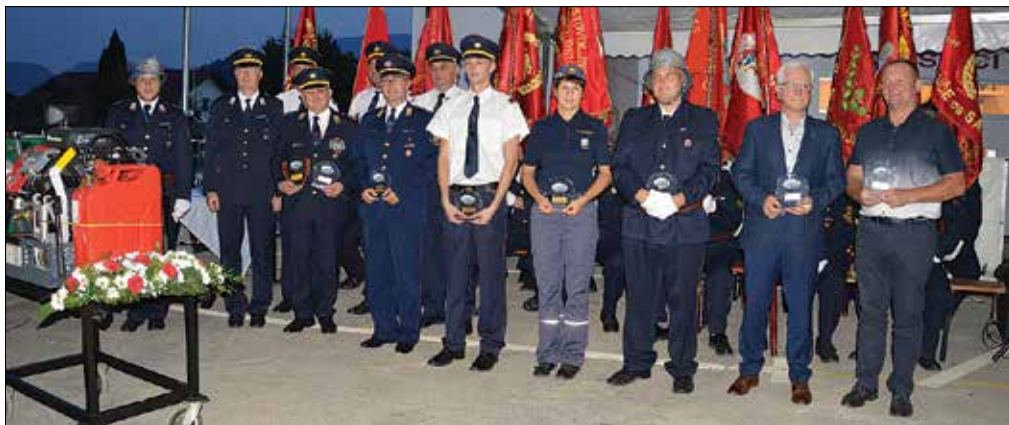
Največji donatorji za obnovo gasilskega doma in nabavo opreme so prejeli spominske kipe.