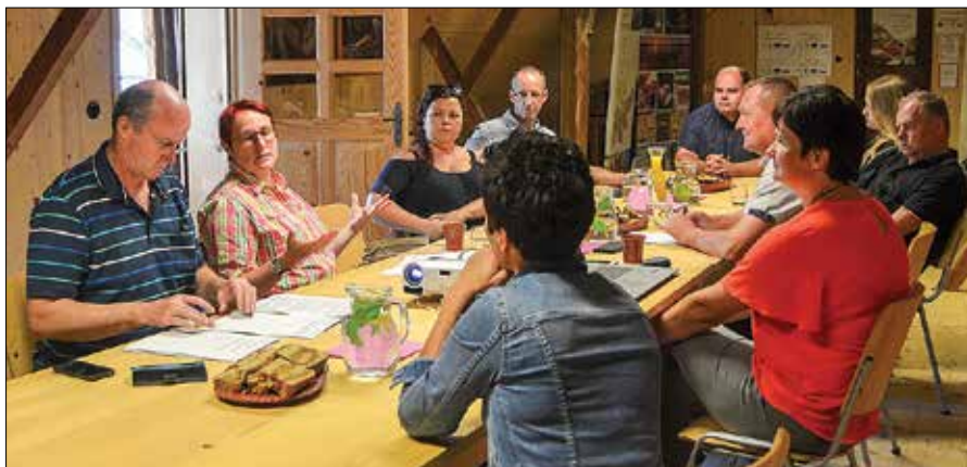
Predstavniki Občine Ljubno in Zavoda Savinja so v prostorih Fašunove hiše ocenjevalni komisiji z več vidikov predstavili območje občine.