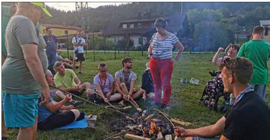
Uporabniki in skavti so si skupaj pripravili večerjo ob tabornem ognju.