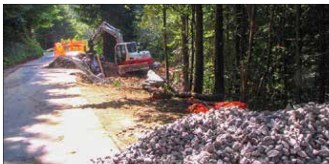
Dela na cesti v Lepi Njivi

V minulih dneh je bil delno oviran promet na cesti Mozirje–Mostnar v Lepi Njivi. Izbrani izvajalec podjetje Pavčnik, nizke gradnje, transport in storitve iz Dola pri Hrastniku, je na odseku ceste Pezdel–Ržiše gradil podporni zid. Cesta in brežina je bila močno načeta v lanskem junijskem deževju, zato je bila ureditev nujna, pravijo na Občini Mozirje.