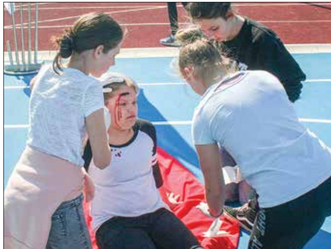
Učenke iz OŠ Rečica ob Savinji svoje znanje prve pomoči preverjajo v zaigranih realističnih situacijah na tekmovanjih. (Foto: MK)

S sistematičnim učenjem PP bi bilo po prepričanju RKS potrebno