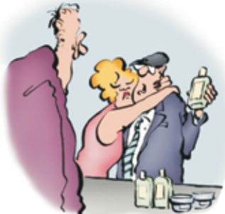
Kupil bom še eno steklenico tele vodice za po britju.