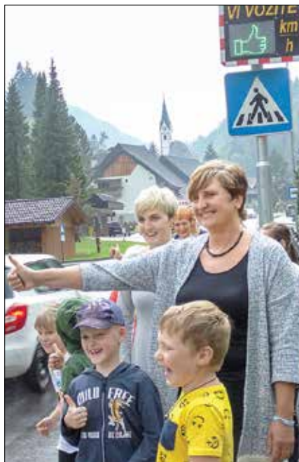
Ob predstavitvi prikazovalnika hitrosti v Solčavi je bilo živahno.

V občini so se letos prijavili na javni razpis agencije za varnost prometa v sodelovanju s