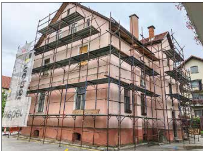
Dela na občinski zgradbi bodo predvidoma zaključili oktobra.