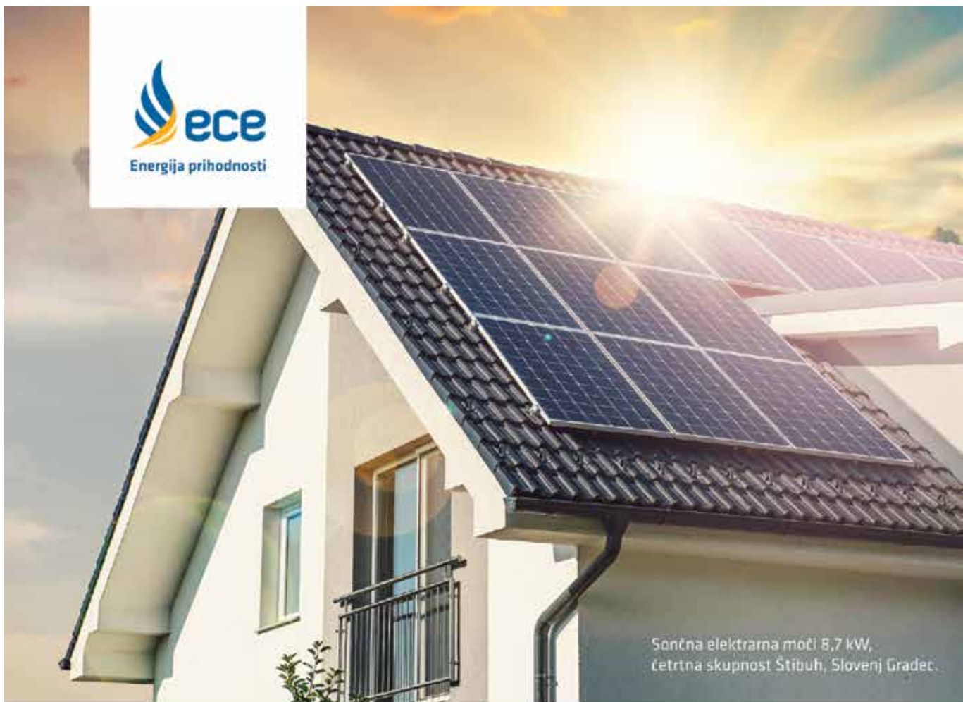
Sončna elektrarna moči 8,7 kW, četrtina skupnost Štubuh, Slovenj Gradec.