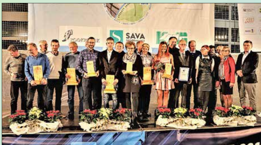
Utrinek z razglasitve športnikov leta 2018 Zgornje Savinjske doline v Mozirju

Vsaka tako velika prireditev, ki ima spoštljivi predznak javnega dogodka kot zahvala športnikom in športu, kljub prostovoljni notni sodelujočih v pripravah in izvedbi veliko stane. Zato si dogodka brez pomembnih sponzorjev, kot so občine, uspešna podjetja ter zavedni nosilci obrtne dejavnosti, ni mogoče predstavljati.