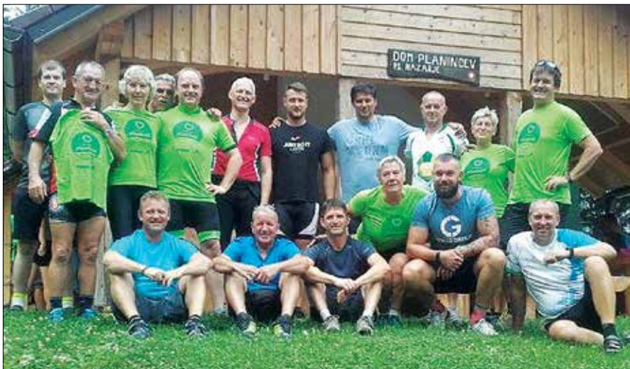
Tokratna kolesarska akcija je bila prvič del vseslovenske akcije, ki spodbuja sodelovanje rekreativcev z različnimi interesi.