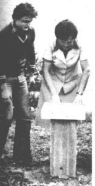
eljni kamen je položila predsednica delavskega sveta a BELE

novimi vlaganji bodo izdatno izboljšali delovne pogoje v neposred-proizvodnji, sprostil bodo sklaa, zaposlili 40 novih delavcev.