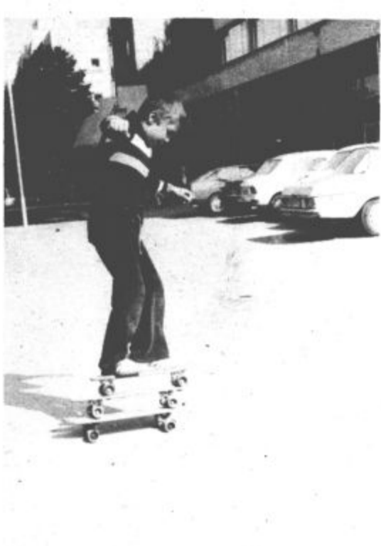
Kotalkarsko drsalni klub Rudar Velenje bo konec meseca organiziral prvo tekmovanje v rolnkah. Kot kaže posnetek, se mladi nanj že nadvse marljivo pripravljajo