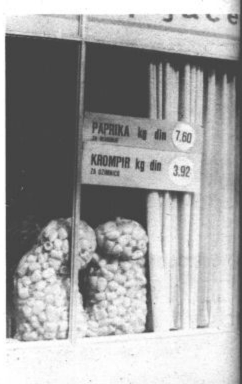
Čeprav je pred nami še vsa jesen, je potrebno že sedaj poskrbeti za ozimnico. Ne bi pozabili priskrbeti vsega, kar bomo potrebovali, nas vztrajno opozarjajo tudi lepaki.