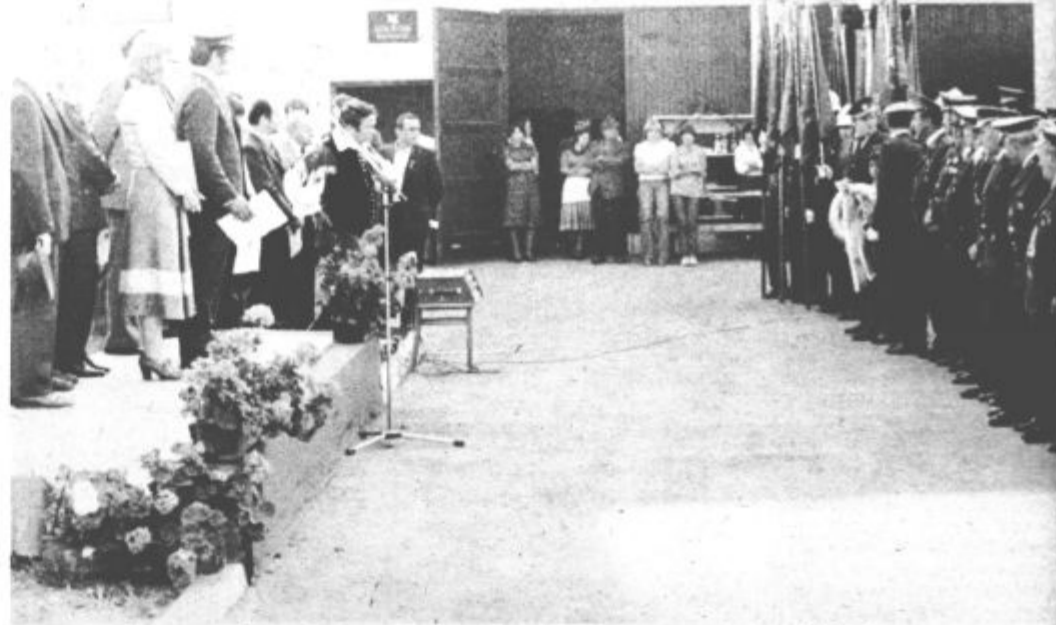
Proslave v Šmartnem so se udeležili mnogi gostje in gasilci sosednjih društev.