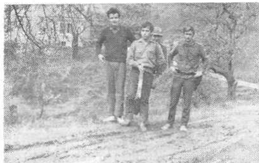
Šiškarji so odlični signalisti, kar so dokazali tudi na pohodu v Mariboru