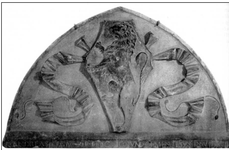
Sl. 3: Grb trogirске plemićке obitelji Cega (Muzej grada Trogira).

U prvoj polovici 14. stoljeća jedna se grupa plemićkih obitelji okuplja oko promletački orijentiranog Mateja Zorića iz roda Cega, (Vitturi, Casotti, Chiudi, Lucio, Ursus, Mazzarello, Quarco, Pecci), dok je druga grupa trogirskih obitelji, predvođena s Marinom Andreisom, bila na strani Bribiraca (rodovi Andreis, Buffalis, Cippico, Cega, Domišić, Vodovar) (Kostrenčić, Laszowskii, 1910, 42, 157, 304, 371, 388, 392, 401). Politiku savezništva pojedinih rodova, kao i njihova suparništva određivali su prvenstveno njihovi gospodarski interesi i unutrašnji odnosi u komuni. Neke obitelji (primjerice Cega i Andreisi), imale su posjede izvan granica komune, te im je odgovaralo vrhovništvo Bribiraca.