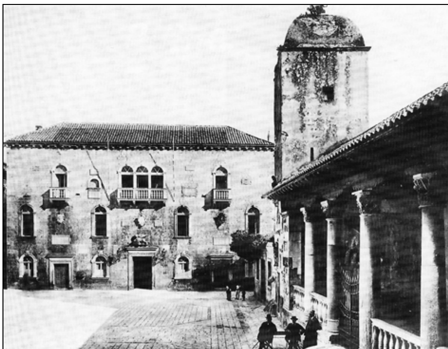
Sl. 2: Srednjovjekovni gradski trg u Trogiru.