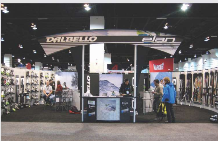
Elan na sejmu SIA

Znameniti severno-ameriški sejem športne industrije SIA je od 28. januarja do 2. februarja potekal v Denverju, kamor se je preselil iz Las Vegasa. Ta velik dogodek je bil prvič povezan tudi s testiranjem opreme na snegu v Winter Parku zvezne države Colorado. Poleg vseh svetovnih znamk v zimski industriji je bil predstavljen tudi Elan in odzivi na novo kolekcijo smuči so bili zelo dobri. Na snegu je bilo mogoče testirati tudi novosti na področju funkcionalnih lastnosti smuči, ki jih je bilo s strani konkurence kar precej. Test je bil nekoliko specifičen zaradi zahtev trga zahodne obale ZDA, kjer prevladujejo predvsem širše smuči z "rocker" tehnologijo. Elan so trgovci ocenili zelo dobro, a nas v prihodnje čaka precej izzivov, da bomo ohranili primat najbolj inovativnega v industriji.