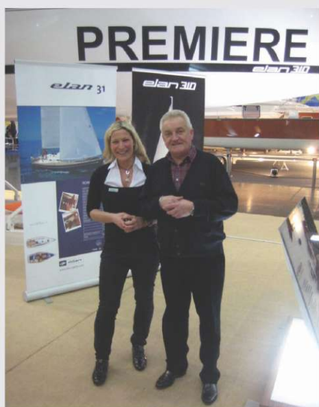
Polona Okorn in minister za zdravje Borut Miklavčič