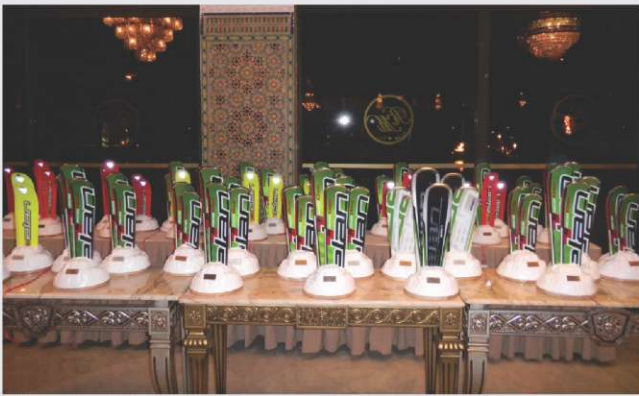
Elanovi pokali za svetovno prvenstvo