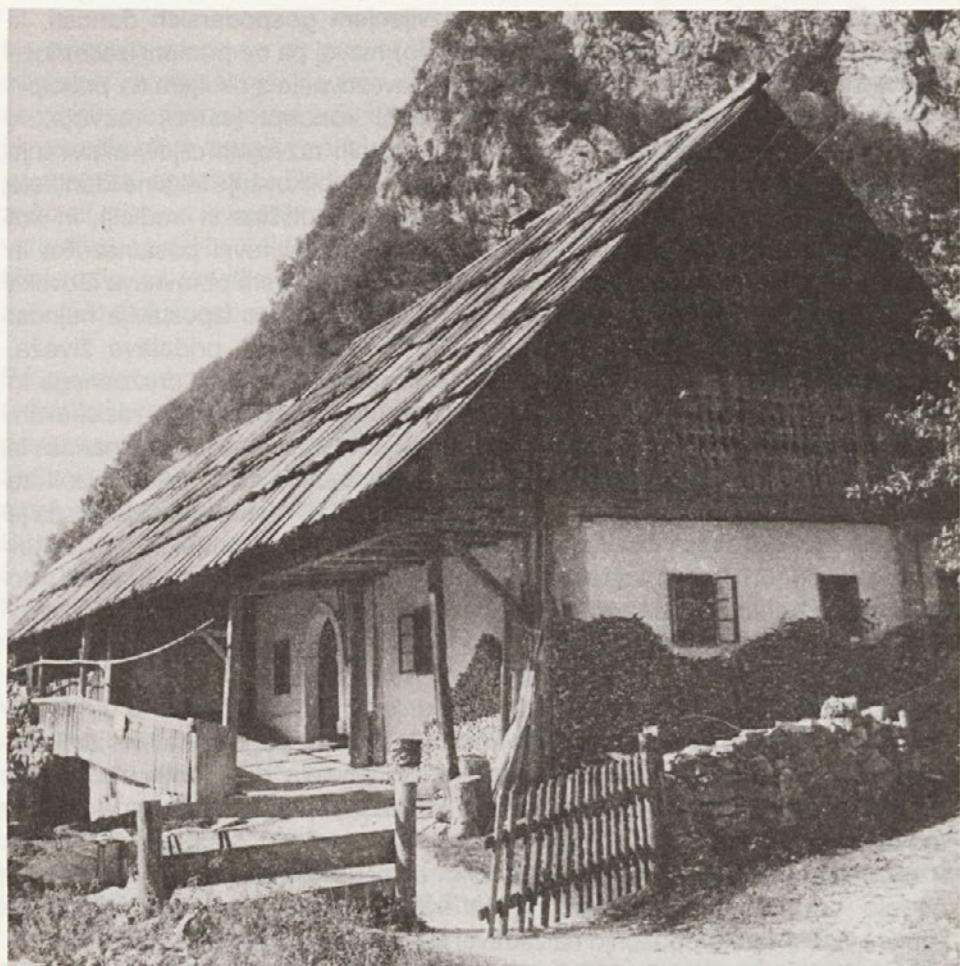
Vrhhlevna hiša v Bohinju, dolina Studor.