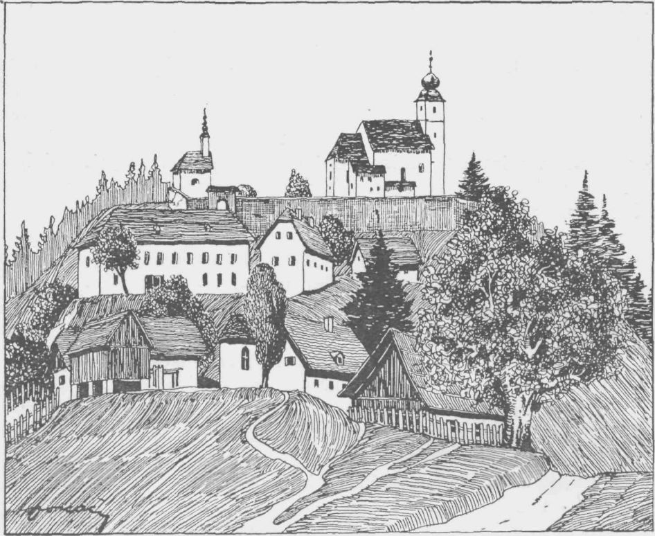
Sv. Duh na Ostrem vrhu (na Kozjaku) 907 m.