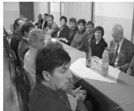
Občan - 23. marec 2006