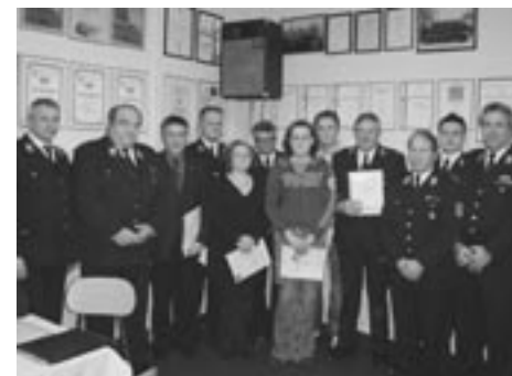
Dobitniki priznanj z vodstvom dru- šтва in GZ Destrnik