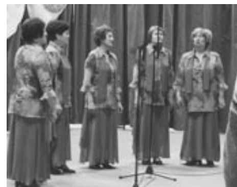
Ženska pevska skupina Spominčice DPD Svoboda Ptuj