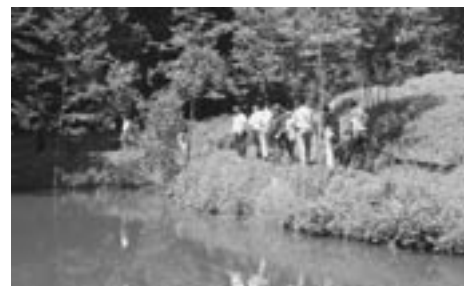
Sprostitev v naravi ob ribniku Pečjak