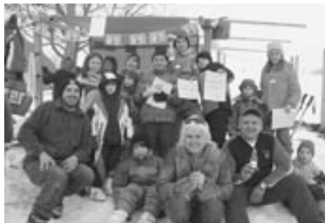
Gasilski posnetek z dobitniki pokalov v veleslalomu in skokih

Člani Športno-rekreacijskega društva Urban so se v soboto, 11. februarja, v prostorih Bara Grozl sestali na občnem zboru. Zadovoljni so z opravljenimi nalogami.