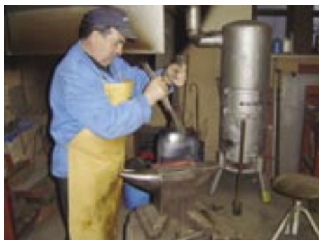
Pločevino, ko jo vzamemo iz žerjavice, hitro upognemo