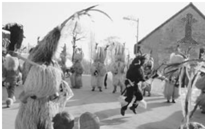
Na povorki na Destrniku