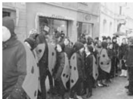
Pikapolonice so poletele kljub snegu

S slovenjegoriških gričev so s pomočjo otroških trgovin Pikapolonica na pustno soboto in nedeljo na ptujске ulice poletele pikapolonice, kar 80 jih