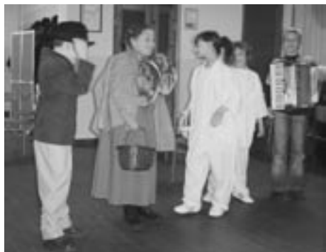
Osnovnošolci in »muzik terapija«

Člani TD Destrnik so se 10. februarja zbrali na 25. občnem zboru, na katerem so pregledali delo preteklega leta in zastavili smernice za to leto, ki ga bodo obeležili, kot se za 25 let delovanja spodobi. V kulturnem programu so nastopili Ljudske pevke Urbančanke in učenci OŠ Destrnik-Trnovska vas, ki so predstavili projekt Term Janežovci, s katerim bodo nastopili na tekmovanju Turizmu pomaga lastna glava, ki bo 23. marca v Makolah.