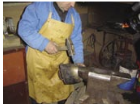
Zvonec na vsaki strani zakovičimo

Material mora biti koven, da se pri kovanju utrdi – najboljša je pločevina z dodatkom 0,2–0,3 % bakra, saj ima to lastnost, da bolj jo ku-