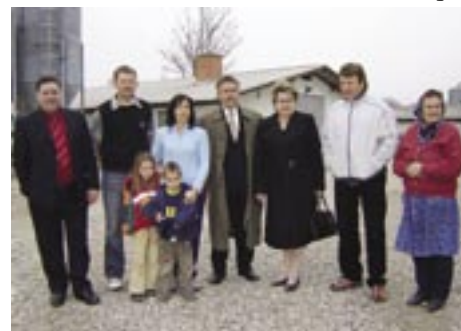
... pri Matjašičevih