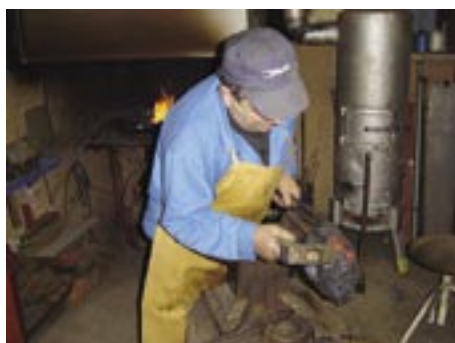
Pločevina dobiva končno zvončasto obliko

Pri zvoncu so pomembni: vrsta in kakovost materiala ter oblika.