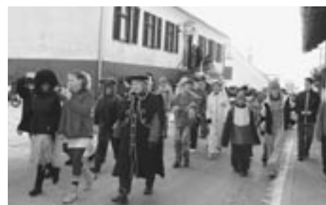
Povorka po Destrniku