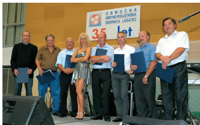
25 let vodijo svoje obratovalnice in podjetja