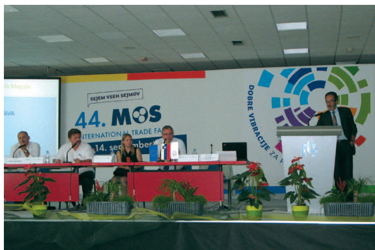
Skupščina Sekcije za gostinstvo in turizem pri OZS, na MOS 2011

»V projekt je trenutno vključenih 30 gostiln v Sloveniji. Pogoji za pridobitev »izvese« z emblemom GOSTILNA SLOVENIJE je ponudba najmanj dveh slovenskih narodnih jedi. Celoten strošek postopka pridobitve blagovne znamke z vključeno »izveso« stane 1.000,00 eur .