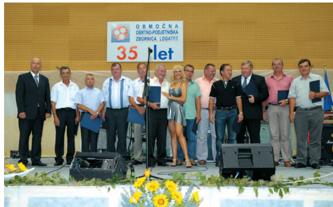
Lastniki in vodje že 30 let