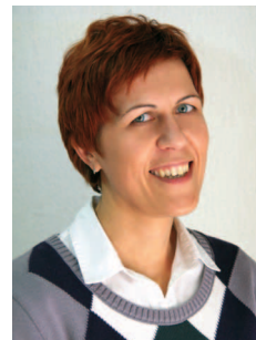
Pripravlja Irena Dolgan