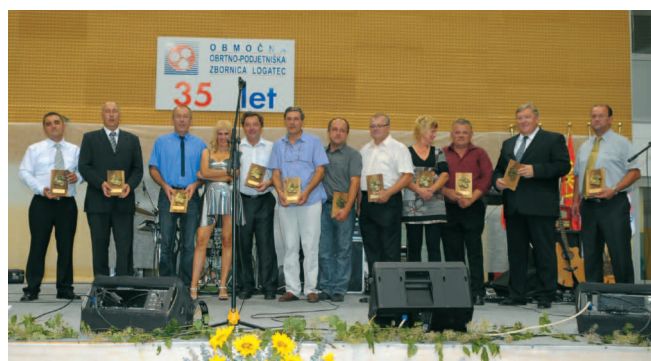
Plakete so prejeli skoraj vsi člani upravnega in nadzornega odbora ter vodstvo skupščine OOOZ Logatec v minulem mandatnem obdobju