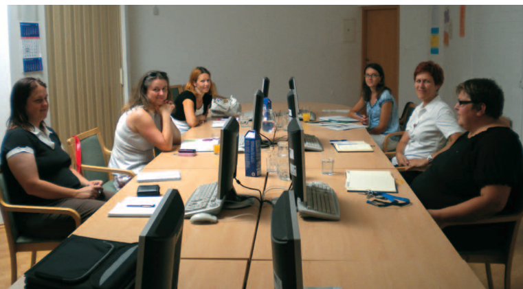
Na RRA NKR v Pivki je tekla beseda o promociji poklicev