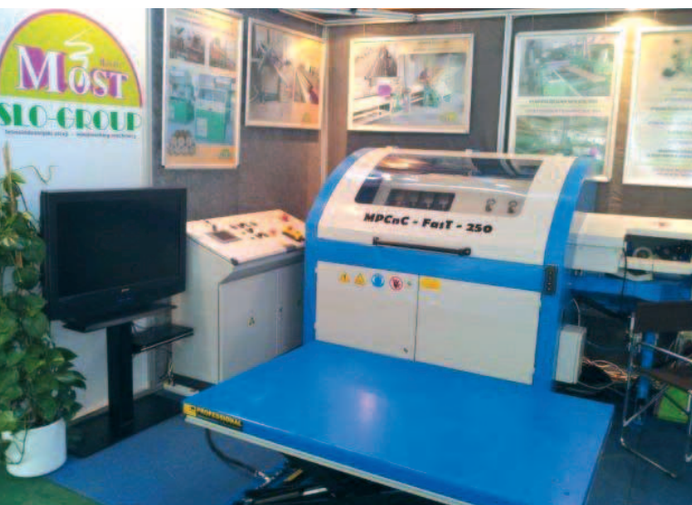
Naprava, ki je sprožila veliko zanimanja in priznanja

Prisotni so bili enotni v mnenju, da je nujno, da OZS za naslednje leto »zlobira« na MOS-u določene ugodnosti oz. bonitetete za člane OZS, saj člani in OZZ-ji prispevamo dobršen del k promociji sejma in oglaševanju!