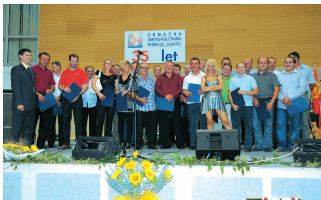
Lastniki in vodje obratovalnic že 10 let