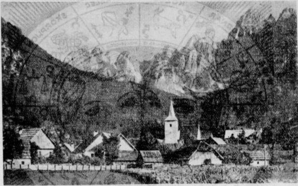
Ovčja vas pri Trbižu

Kraji, ki ne smemo pozabiti, da so slovenski