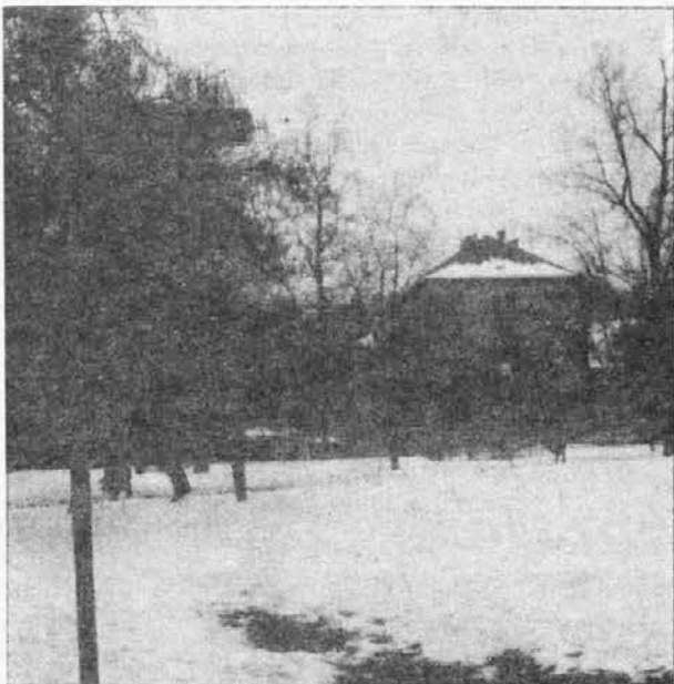
Zgoraj: Argentinski trg v Ljubljani v snegu.

Kot je znano, imamo v Argentini že nekaj ulic, imenovanih „República de Eslovenia“, kakor tudi lepih trgov. Argentina je država, ki je ena prvih priznala Slovenijo v njeni samostojnosti, slovenska vlada z dr. Drnovškom na čelu kaže izredno zanimanje, da se ekonomsko poveže z Argentino in preko nje z vso Južno Ameriko. Argentina ima tudi drugo največjo emigracijo iz