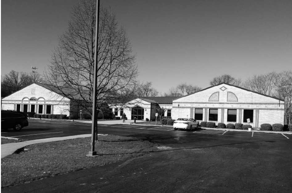
Slika 2: Slovenski dom v Lemontu

Slovenščino ljubiteljsko poučujejo tudi prostovoljci po najrazličnejših naselbinah, zlasti na zahodu ZDA, ki prihajajo največkrat iz vrst slovenskih novih naseljencev iz časov po drugi svetovni vojni. Slovenskim Američanom poskušajo približati slovenski jezik in kulturo, njihovi učenci pa pripadajo najrazličnejšim generacijam ameriških Slovincem in različnim starostnim skupinam.