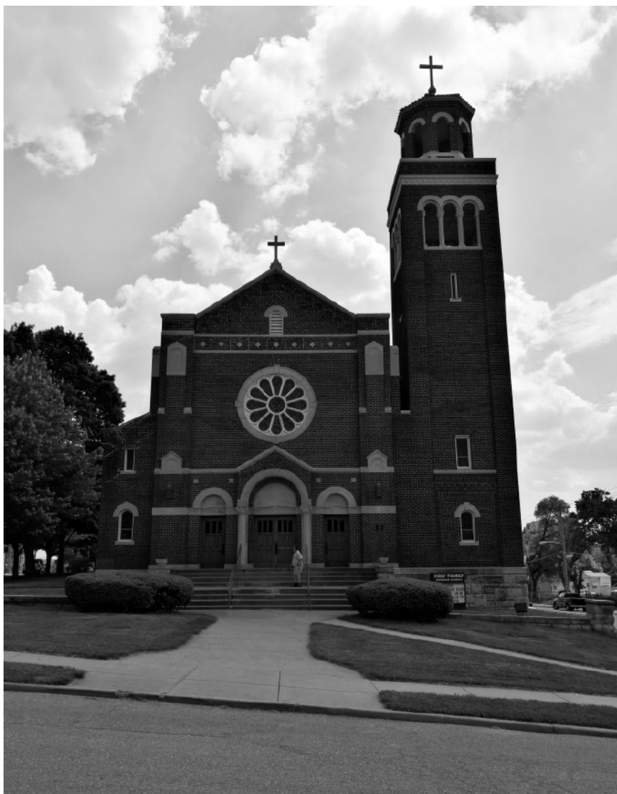
Slika 1: Cerkev v Kansas Cityju, Kansas

dominikank na drugi ulici in potem pokrepčane odšle na pot do cilja. Družba sv. Rafaela jim je tudi izposlovala, da so se vozile dalje ne v izseljeniškem tretjem razredu, ampak v 1. kar jim je gotovo olajšalo dolgo potovanje. Ko bi se bile sestre preje obrnile na družbo sv. Rafaela za svet in za pomoč, bi jim bila družba prihranila mnogo nepravil, mnogo lepše uredila potovanje, zlasti bi jim pa mogla kot redovnicam izposlovati polovično vožnjo do Kansas City, kar bi pri 4 sestrah pomenilo že nad $50.00. Seveda so č. s. z veseljem pretrpele vse nepravilke, tudi poniževanje, ko so se morale na Nemškem voziti v živinskih vozovih, ter vse to darovale kot prvi dar njihovega misijonskega življenja v Ameriki. (Friš 1992: 371–389; Slovenske šolske sestre v Ameriki 1909; 69–70)