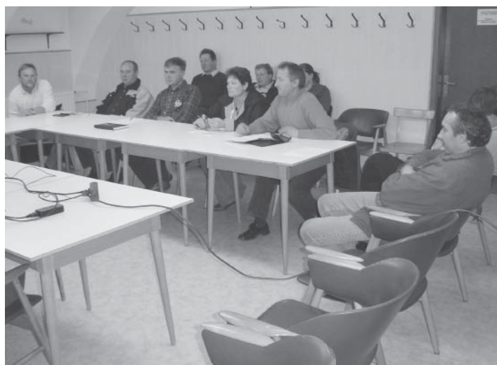
Sestanek je bil slabo obiskan