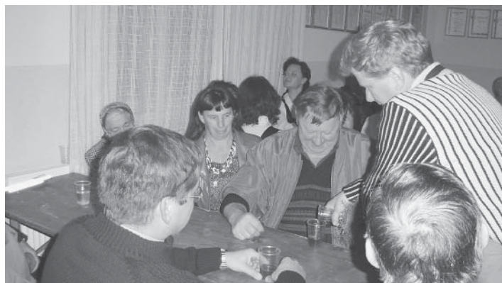
Pokušnja letošnjega letnika