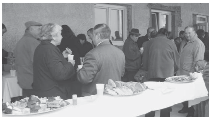
Pogostitev se je razvila v prijetno druženje