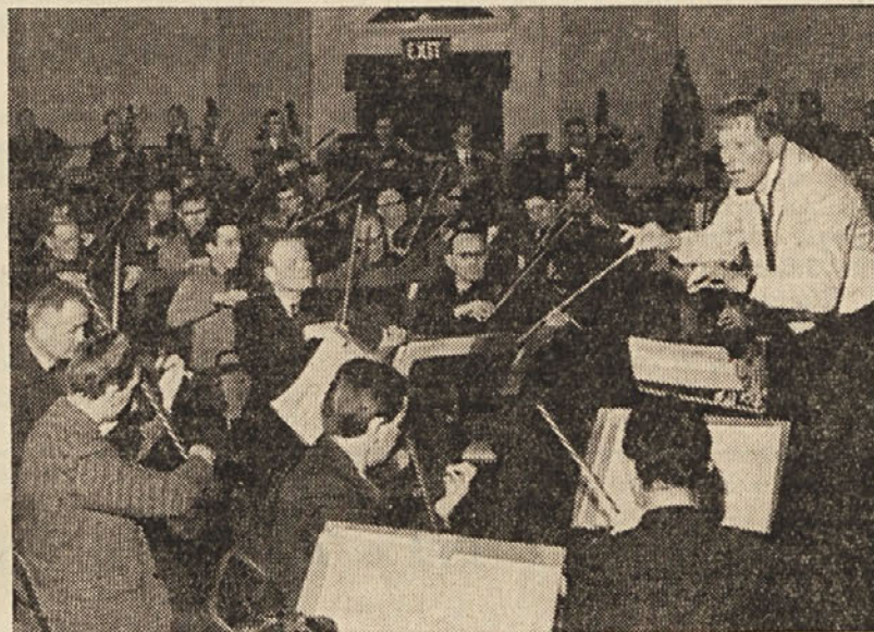
Več tisočglava množica poslušalec v londonski Albert Hall se je prijetno zabavala, ko je igral Londonski simfonični orkester dela: Ravela, Strauša, Sousa in Čajkovskega pod taktirko znanega ameriškega komika Dannyja Kaya. Koncert je sijajno uspel in je pripomogel k finančni ozdravitvi tega slavnega orkestra.

Uspeh je bil ta, da so Rimljani ukazali Kineju, naj gre takoj iz mesta in naj pove svojemu gospodarju, da z njim tako dolgo ne bodo govorili o miru, dokler bo stal na rimljanski zemlji. Lahko si mislite s kakšnimi vtisi je Kinej stopal k svojemu gospodarju in nič preveč ni rekel, če je zatrjeval Piru, da se mu je vse rimsko mesto zdelo kakor veliko svetišče.