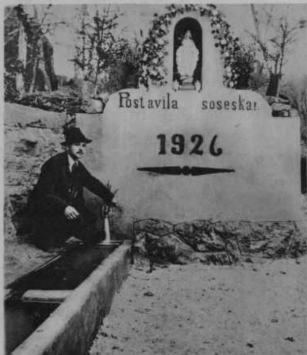
Vas Sela pri Šmarjeti na Dolenjskem si je zgradil iz lastnih sredstev vodovod, dasi šteje vas samo 7 posestnikov. Dokaz naprednosti, pridnosti in vztrajnosti našega kmeta.