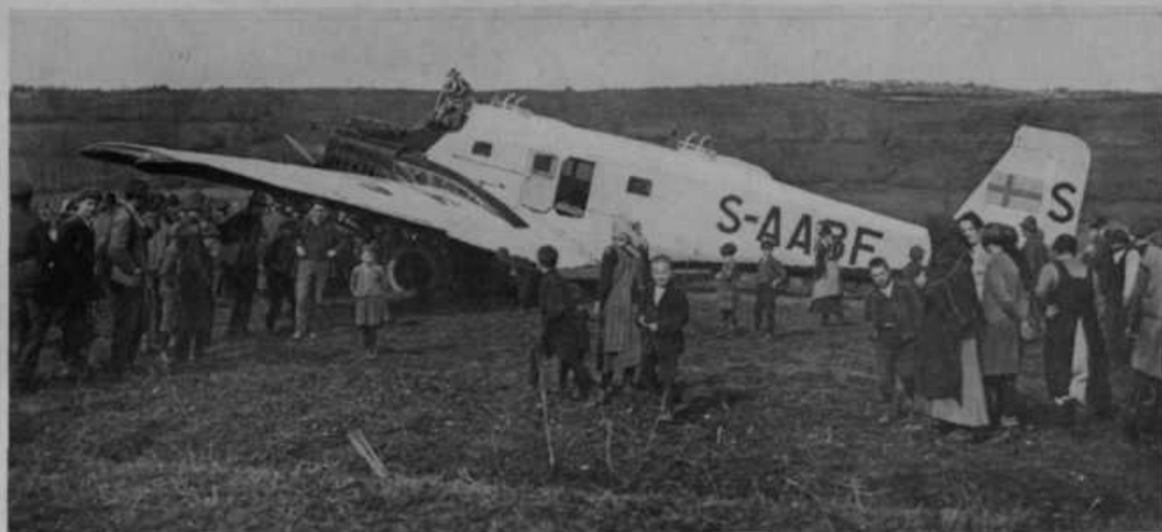
Švedsko vojaško letalo, ki je izgubilo smer ter se je moralo 11. marca pri Cerknici spustiti na tla, odkoder je v par dneh zopet odletelo. Letalo je pravi orjak. S krili vred meri 52 m in je težko 4000 kg. Bencina vzame s seboj 5000 kg. Ima 3 motorje s 1000 konjskimi silami.