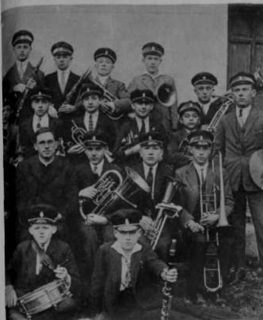
na Rakovniku pri Ljubljani.