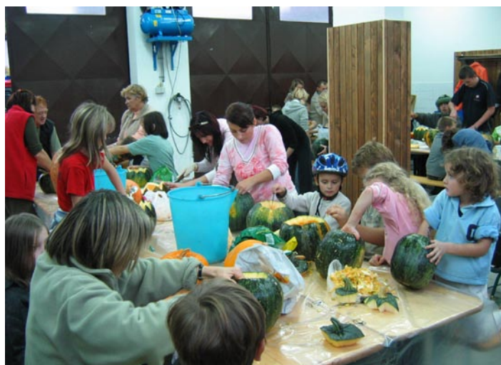
Ustvarjalci strahov pri svojem delu