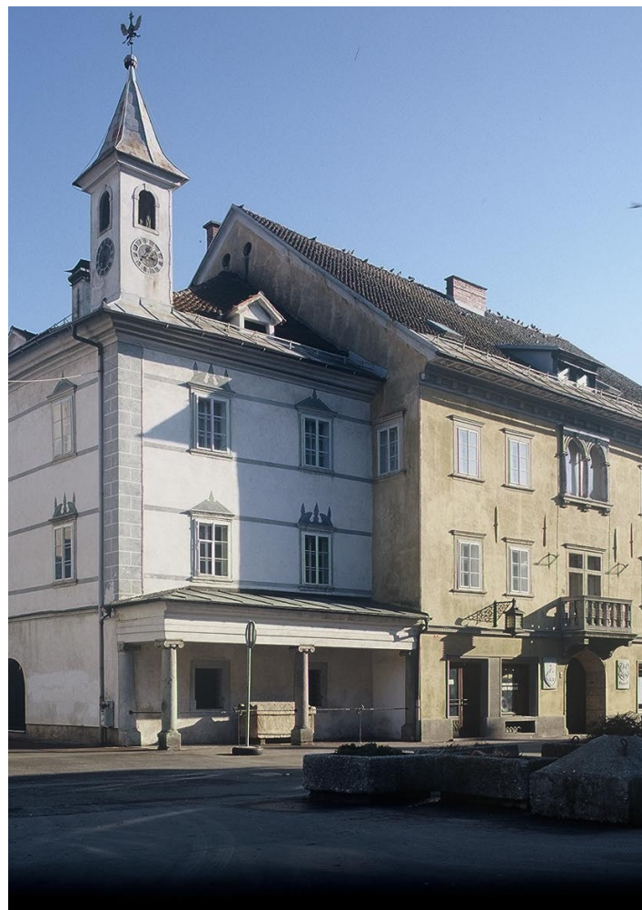
Galerija Mestne občine Kranj