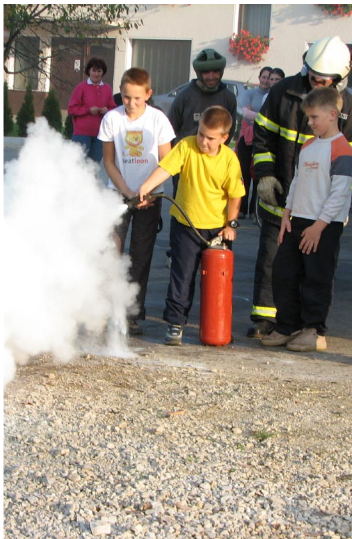
Mladi pri praktičnem gašenju