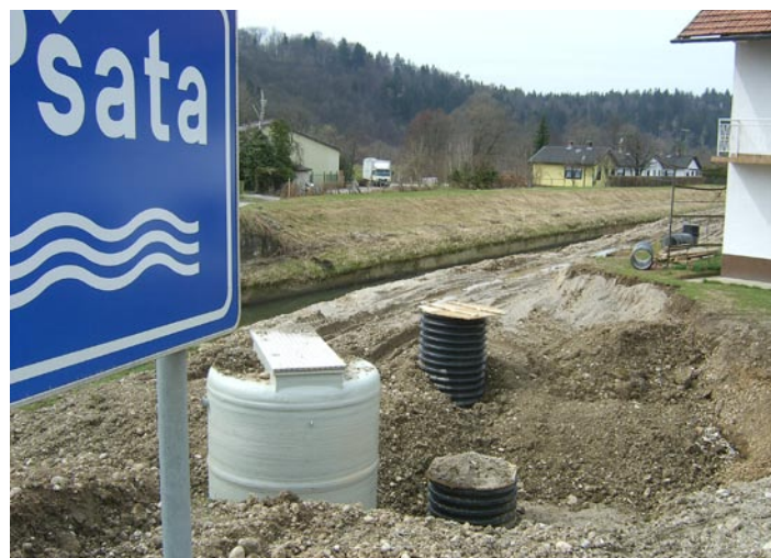
Črpališče za prvo etapo obratovanja, ki se nahaja ob mostu čez razbremenilnik Pšate na Prešernovi / Gorenjski cesti.