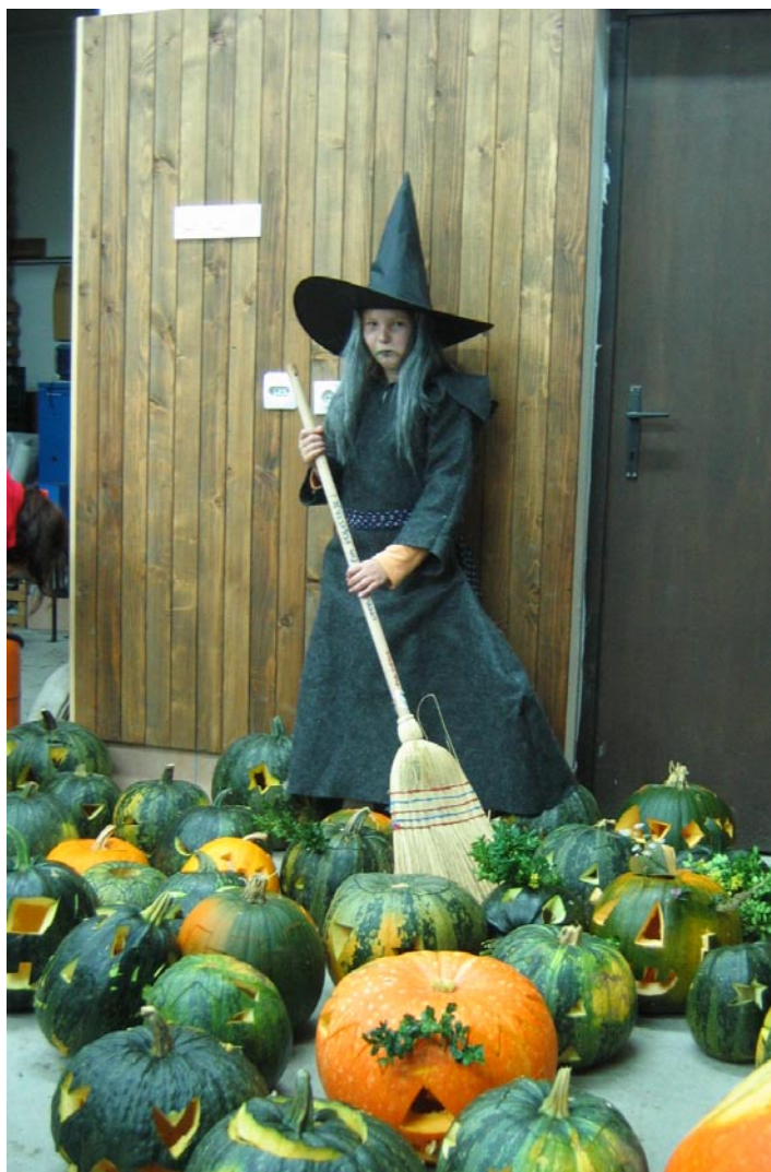
Maskota ustvarjalne delavnice

Mladi zelo radi sodelujejo pri praktičnih prikazih, tako je bilo tudi na "Dnevu odprtih vrat" v PGD Topole, ki je potekal v sklopu meseca požarne varnosti. Glavna tema srečanja je bila seveda predstavitev več vrst gasilnikov, za mlade in starejše obiskovalce pa so bili še posebej zanimivi prikazi eksplozije plinske kartuše in doze spreya, še posebej prikaz maščobne eksplozije. Obiskovalci so lahko praktično preizkusili gašenje z gasilnikom na prah, pri tem so mladi neustrašno in uspešno pokazali, da jim gašenje ne dela težav.