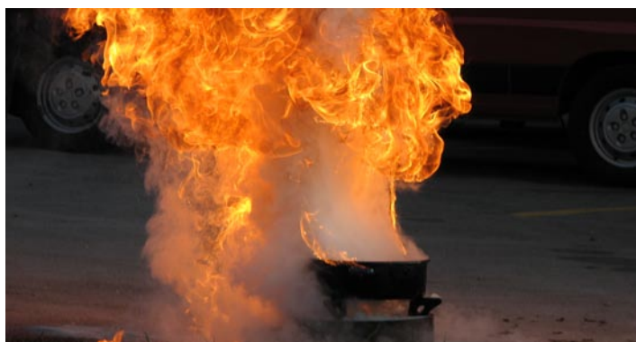
Učinek maščobne eksplozije