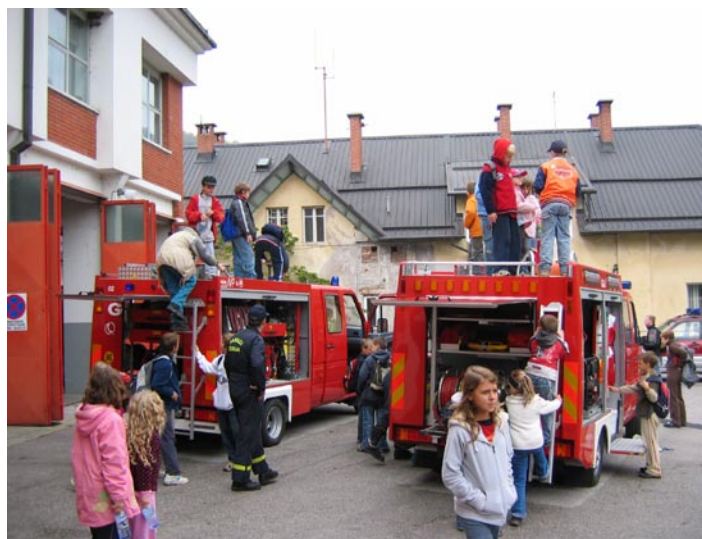
Ogled gasilskih vozil