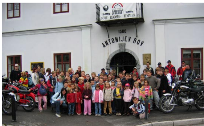
Pred vhodom v Antonijev rov