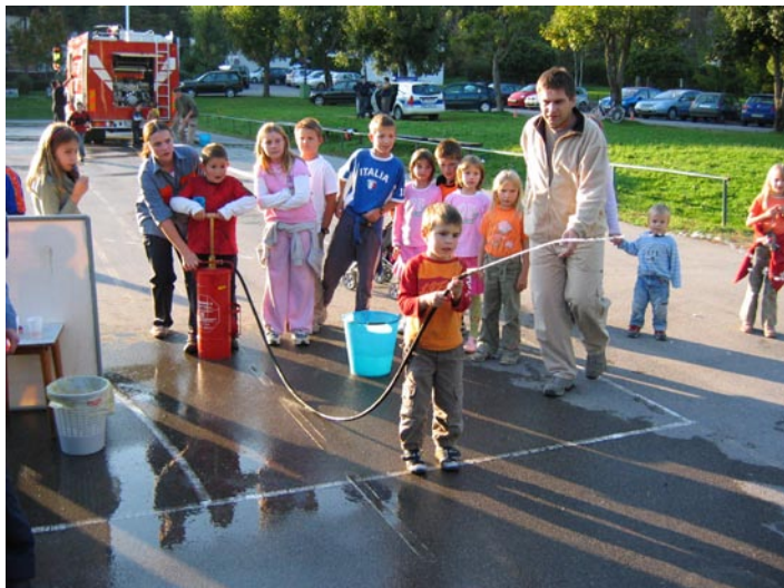
Mladi preizkušajo svojo spretnost

Vsako leto v mesecu oktobru za vso gasilsko mladino v Gasilski zvezi Mengeš, organiziramo strokovno ekskurzijo, ki je bila tokrat namenjena spoznavanju zgodovine rudnika živega srebra v Idriji. Ogledali smo si muzejski Antonijev rov, razstavljene eksponate strojne opreme za delo v rudniku, glavni cilj pa je bil obisk pri idrijskih gasilcih, ki so nam prijazno predstavili svoje delo in področje katerega pokrivajo. Še najbolj zanimiva je bila gasilska tehnika, ki jo je nekoliko več, kot jo lahko vidijo