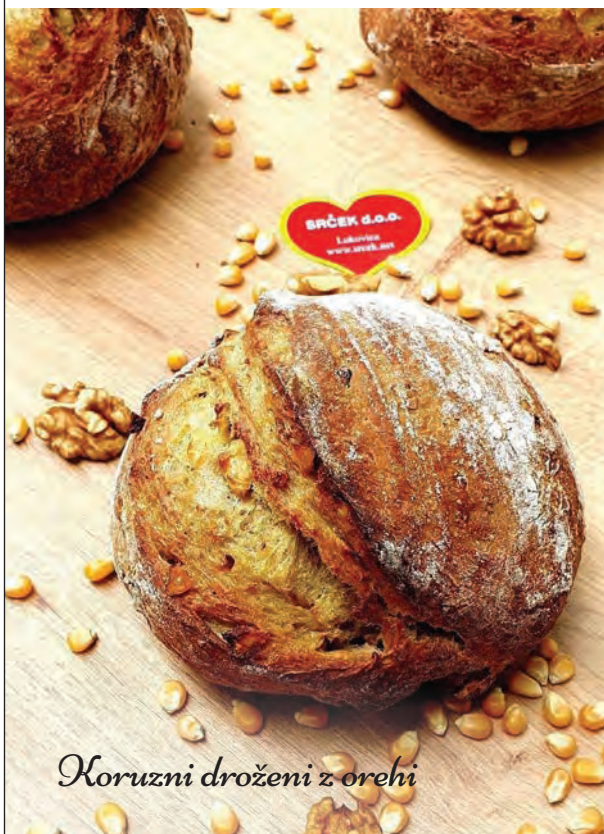
Koruzni droženi z orehi