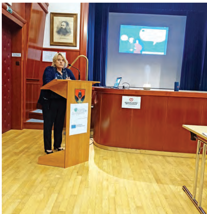
Pozdravni nagovor županje.

V sklopu projekta smo skupaj s Točko za starejše Lukovica 24. oktobra 2023 v Lukovici izvedli še dogodek »DAN ZA SKRIB ZASE«, ki so se ga udeležile osebe iz Lukovice, Šmartna pri Litiji in Litije. Delavnica ni bila