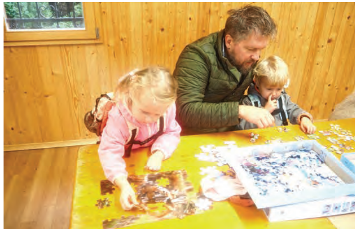
Sestavljanje puzzlov je miselna igra za mlade in starejše.

Ti puzzli so unikatna serija iger v obliki sestavljanek, ki združujejo elemente sestavljanja in reševanja ugank. To je tudi izziv, ki zahteva logiko, intenzivno razmišljanje in sodelovanje med igralci. Vsaka igra ima svojo zgodbo in temo, od pobega iz zapuščene hiše do raziskovanja skritega otoka ali laboratorija, tudi ob pomoči kartic z namigi, zemljevidi ..., kar je nudilo igralcem edinstveno doživetje, pri čemer so nekatere sestavljali celo dvakrat. Udeleženci so se po kosilu vrnili, da bi rešili še zadnji dve sestavljanke, kar