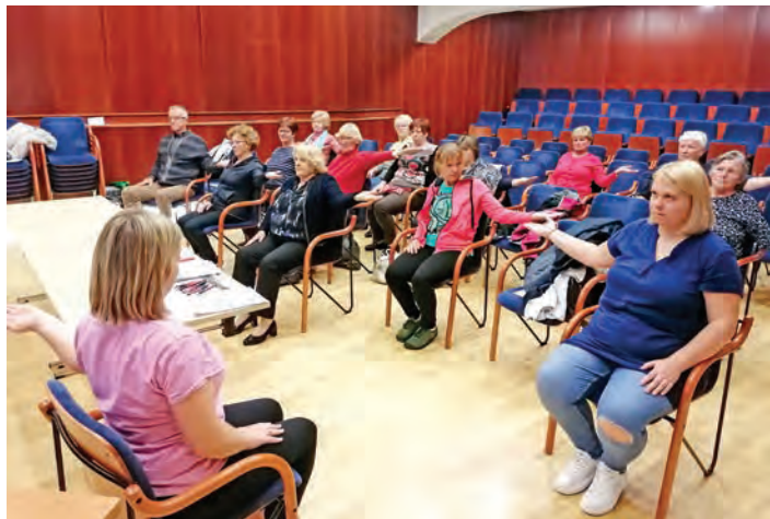
Izvedba joge z aromaterapijo na »Dnevu za skrb zase« v Lukovici.

V okviru Erasmus+ projekta SupportCARE, ki nudi podporo neformalnim oskrbovalcem za boljšo prihodnost oseb z demenco, je bilo od 10. do 12. oktobra 2023 izvedeno prvo usposabljanje v Belgiji. Demenca je poimenovana kot tiha epidemija sodobnega časa in soočanje s to boleznijo je nepredstavljivo težko tako za obolelega kot za njegove bližnje. S projektom in usposabljanji želimo oskrbovalce opremiti s konkretnimi orodji, da se bodo lažje soočali s številnimi nalogami, ki jih dnevno opravljajo.