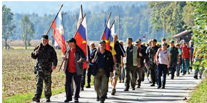
Na poti na Gobavico nad Mengšem.