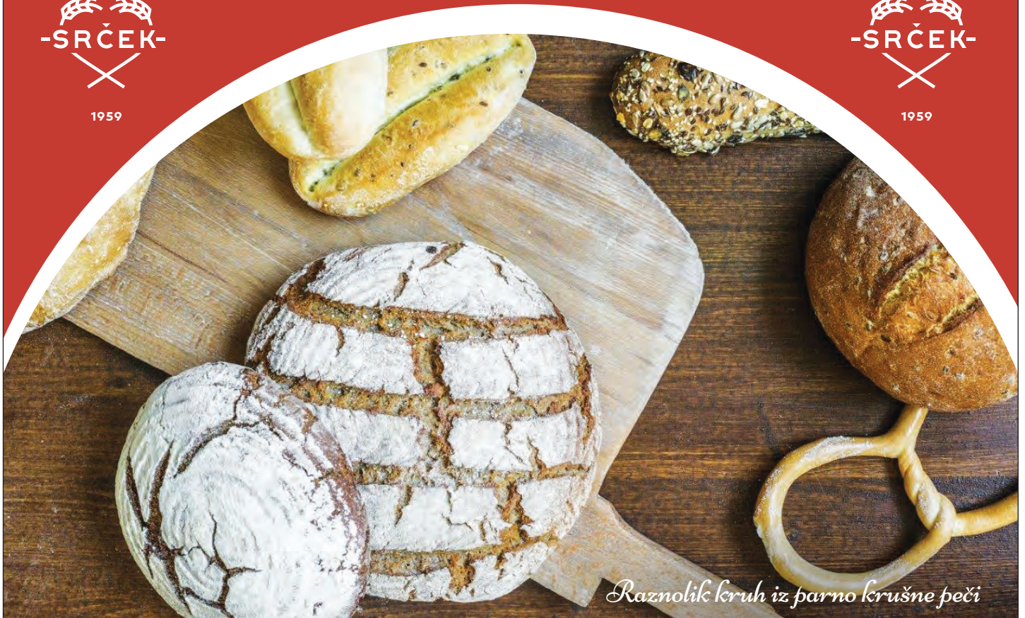
Raznolik kruh iz parno krušne peči