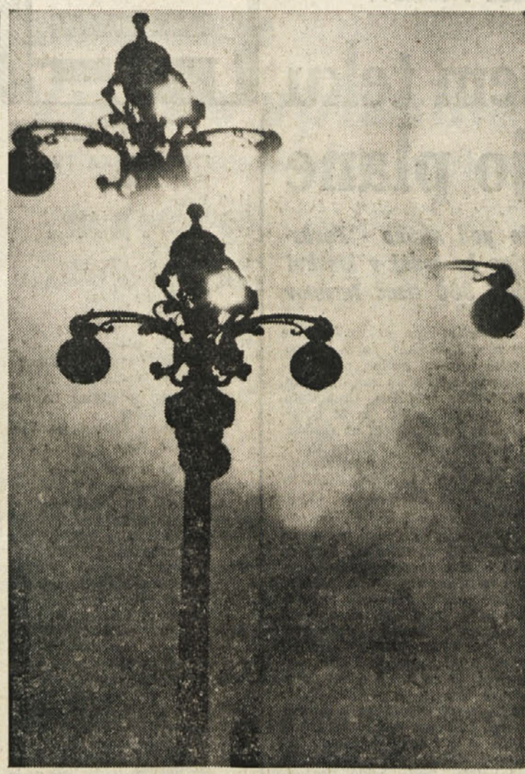
Lampion v megleni noči na Trgu Unità