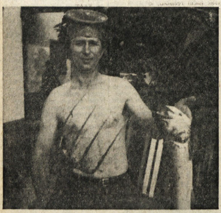
Nasega cričias Sežanci in ne le Sežanci prav dobro poznajo. In tudi vedo, da je le improvizirani ribič in da torej lepe postviri ni ušel z vilami in ne v kalu pri Lipcih, kot tudi v kakem drugem kalu na Krasu ne, saj ni bilo v kalih nikoli rib, kaj šele lepih postviri. Mož je lepo rib kupil v ribarnici, da pa bi se malo maskiral v ribiča, si je nataknil masko za podvodni ribolov. Ker ribolovne opreme kot pristen Krasevec ni imel, je vzel v roke kar vile...