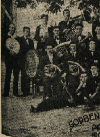
GODBENO DRUŠTVO PROSEK 1904-1979