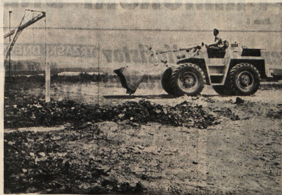
Pred tekmo s škotskimi nogometaši so se na Proseku lotili temeljite obnove igrišča

Skupna lestvica po osmi etapi: 1. Eddy Merckx (Bel.) 40:36'30" 2. Cyrille Guimard (Fr.) 2'33" zaostanka 3. Luis Ocana (Sp.) 2'48" 4. Felice Gimondi (It.) 4'15" 5. Yves Hezard (Fr.) 5'48"