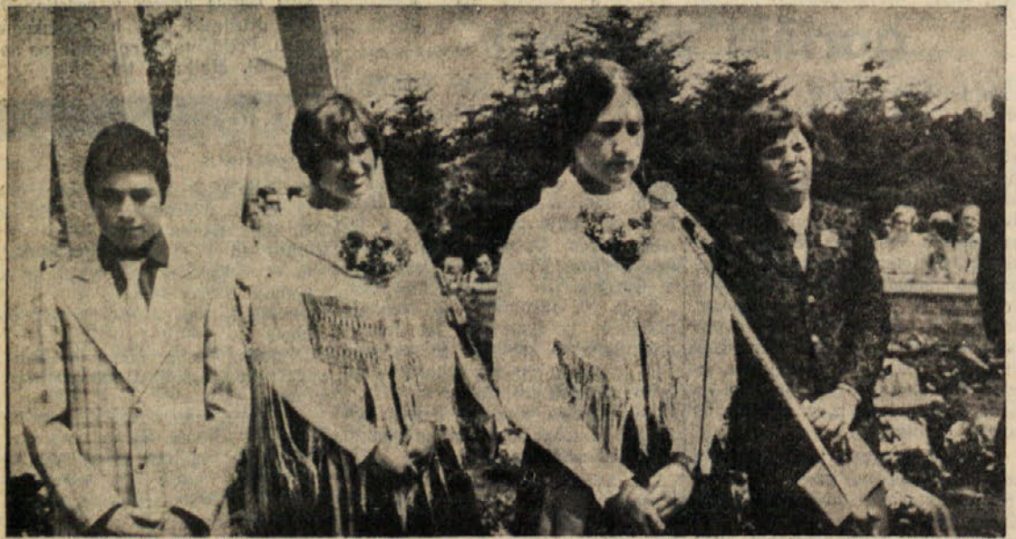
V nedeljo je bil med svečanostjo tudi kulturni spored. Na gornji sliki vidimo štiri mlade domačine, ki so recitirali partizanske pesmi. Na spodnji sliki vidimo del razstave NOB, ki so jo ob tej priložnosti priredili v dvorani PD na Proseku.