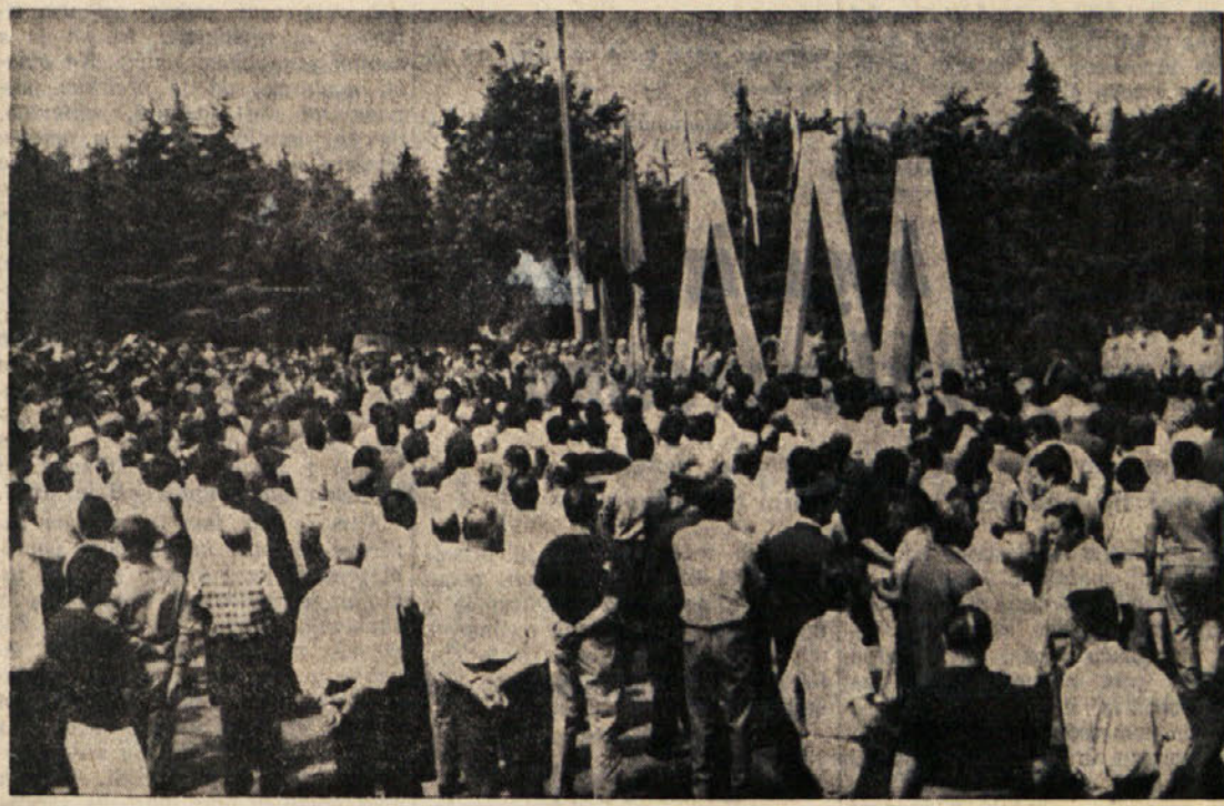
Množica na svečanosti ob odkritju spomenika padlim borcem s Proseka

Slovesnosti je prisostvovala velika množica domačinov in bivših borcev ter gostov, med njimi izvoljeni slovenski in demokratski italijanski predstavniki, predstavniki Zveze borcev iz Slovenije, generalnega konzulata SFRJ v Trstu ter borbeških in antifasističnih združenj