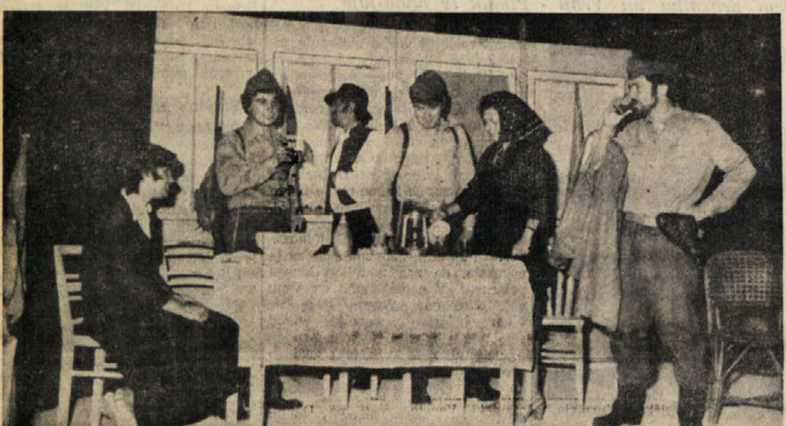
Amaterski oder PD Prosek — Kontovel je za to priložnost pripravil enodejanko Jožeta Potrča 'Izdajalec' (Gornja slika). Na spodnji sliki vidimo del množice na akademiji, na odrju je pevski zbor 'Vasilij Mirko', pod odrom pa je domača godba na pihala.