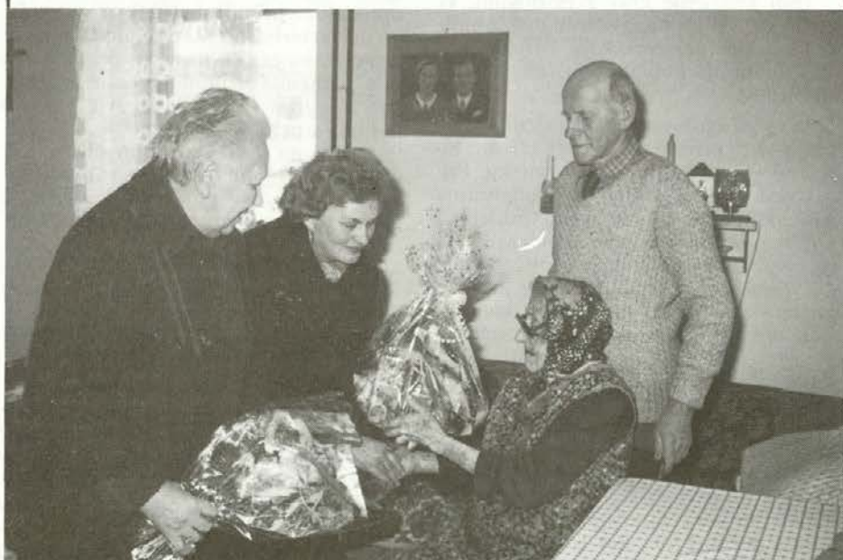
Cestnikovi mami so čestitali