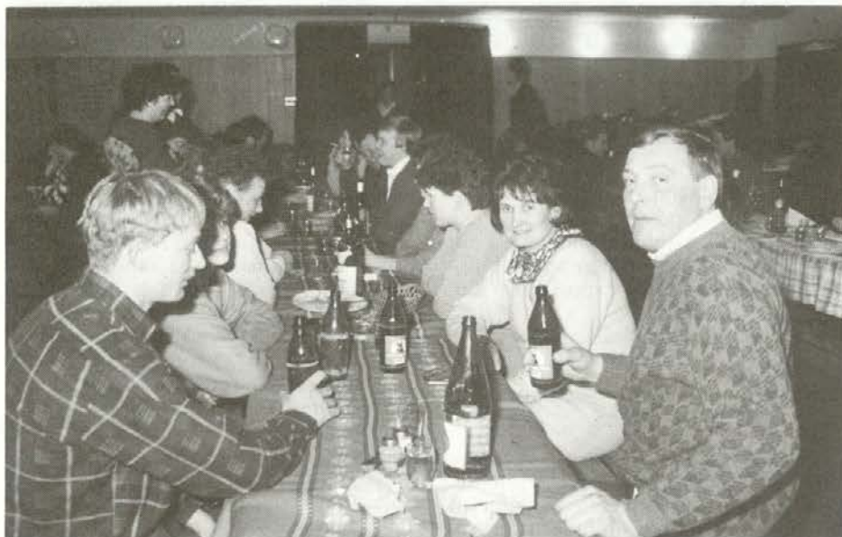
Srečanje kmetov v Podgorju je trajalo do zgodnjih jutranjih ur.