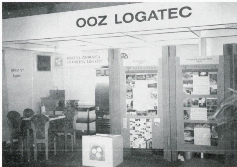
Predstavitve na Goriškem sejmu