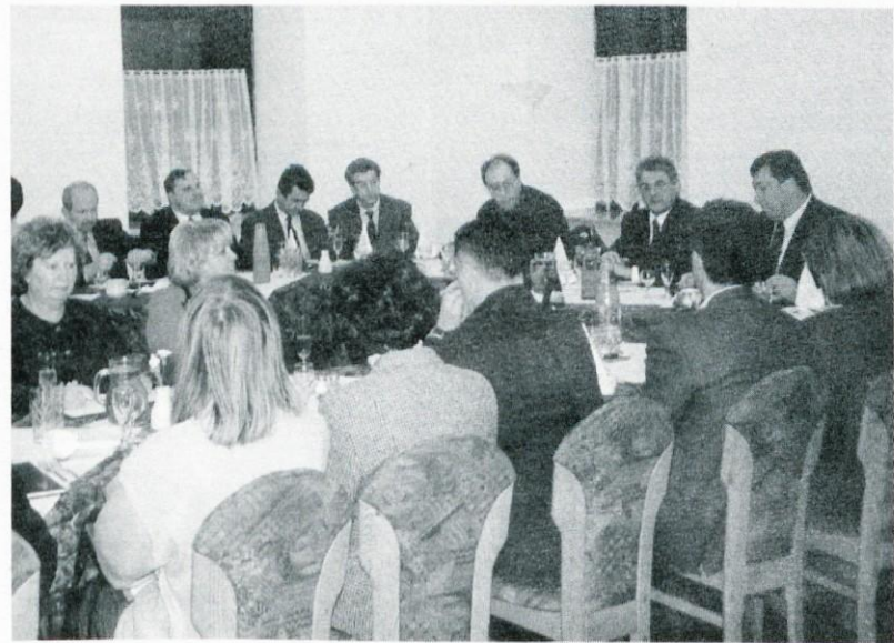
S pogovora predstavnikov obrtnih zbornic v Logatcu