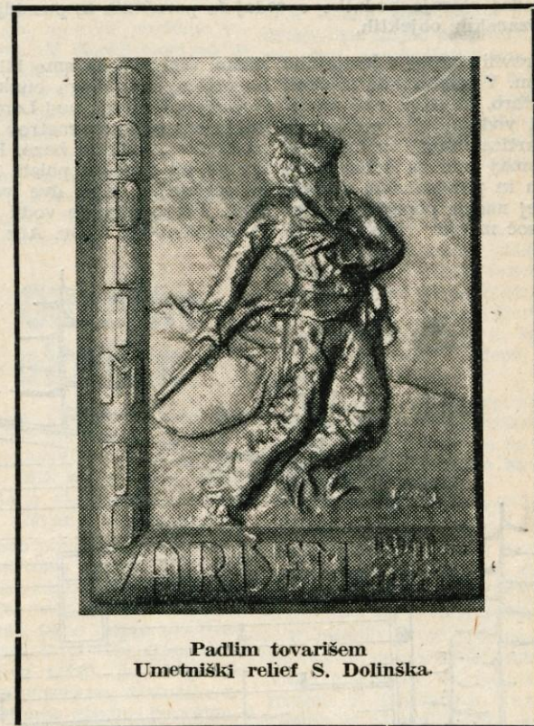
Padlim tovarišem Umetniški relief S. Dolinška

Ko je odgovarjal na vprašanje o socialnih dajatvah, je tovariš Tempo poudaril, da je Jugoslavija glede socialnih dajatev prva v svetu. Vendar je pri tem treba upoštevati vprašanje, v koliko, so socialne dajatve upravičene in koliko lahko naša dežela v današnjih razmerah obremeni družbo s takimi izdatki. Celotni sistem socialnih dajatev bi bilo treba temeljito proučiti, saj čestokrat dobe podpore tisti, ki niso nujno potrebni, tisti, ki imajo vso pravico do njih, pa so večkrat prikrajšani.