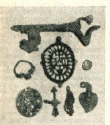
Ključ iz poznega srednjega veka, gotsko oblikovan prstan, obesek s predrto ornamentiko, srebrn novce iz visokega srednjega veka, bronzast relief iz baročne dobe, trije obeski iz 18. stol.

ob vsej severni strani »Prešernovega trga« vrstili v več plasteh grobovi, katerih število je te dni naraslo na 180. V njih najdeni okrasni predmeti (uhani, obsenčni obročki, igle za lase, naprstniki in sponke) po številu, bogastvu in raznolikosti oblik daleč prese-