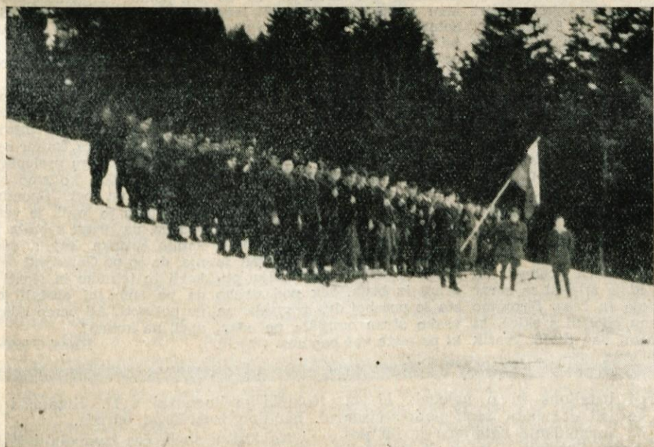
Kokrški odred pod Stolom 1944. leta

Parkiranje tovornih in osebnih avtomobilov bo na vseh dovozih v Goriče označeno z vidnimi opozorili. To velja tudi za kolesa in vozove.