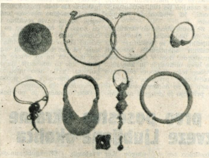
Naramna sponka, speta obsenčna obročka, prstan s poldragim kamnom, obsenčni obroček s stekleno jagodo, lunast uhan, srebrn uhan iz 7. oziroma 8. stoletja, obsenčni obroček.