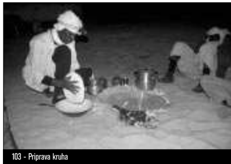
103 - Priprava kruha