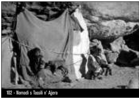
102 - Nomadi s Tassili n' Ajjera