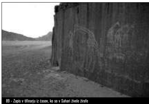
89 - Zapis v tiffinariju iz časov, ko so v Sahari živele žirafe

V nekaterih federacijah prištevajo v plemiško kategorijo tudi skupino ineslemen . Ta ni predstavljala zaprtega stanu, saj je lahko postal pripadnik te kaste vsak član tuareške družbe, ki se je naučil brati koran in imel za učitelja marabuja , 14 in to ne glede na njegov socialni položaj. Šlo je torej za verski razred, ki je bil po islamizaciji 15 Tuaregov pomemben predvsem v nekaterih urbanih centrih (npr. Timbuktu in Agadez).