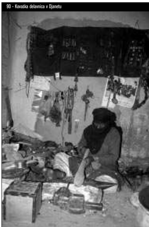
90 - Kovaška delavnica v Djanetu

Tuaregi iz plemiškega stanu z njimi poročali (otroci iz takšnih zakonov so postali svobodni), medtem ko so bile poroke med “ plemiči ” in “ podložniki ” zaradi politične delitve družbe redke (Keenan, 1973: 355). Sužnji so živeli skupaj s svojimi tuareškimi lastniki in opravljali vsa fizična dela, vezana na pašo živali in gospodinjstvo, ali pa so bili naseljeni kot poljedelci, saj se s to dejavnostjo tuareško plemstvo v preteklosti nikoli ni ukvarjalo. V stopnjah njihove odvisnosti so bile med tuareškimi federacijami velike razlike, dejstvo pa je, da so se lahko s časoma osvobodili; ponavadi s poroko ali z odkupom. Tako so se, še preden so francoski kolonialisti sužnje formalno osvobodili, v drugi polovici 19. stoletja oblikovale skupnosti osvobojenih sužnjev, iravélen , nomadskih živinorejcev, kulturno podobnih “ pravim ” Tuaregom. 19 Podoben položaj je imela v današnji Alžiriji tudi kategorija temnopoltih poljedelcev, znanih pod imenom