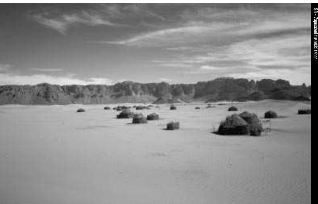
98 - Zaprtašeni tuareški tabor

Začetek 20. stoletja je bil tako za Tuarege še posebej katastrofalen. Na severu jih je francoska vojska v Hogarju prisilila k premirju in jih zapletla v spopade z ajjerskimi Tuaregi. V Nigru pa je francoska vojska izkoristila vmešavanje Turkov in spor med tuareškima skupinama Imezureg in Kel Evej , v katerem so slednji, leta 1901, severno od Damergua izgubili karavano z 12.000 kamelami, natovorjenimi s prosom. Francozi so zato v naslednjih letih formalno okupirali celotno južno obrobje Sahare: Damergu leta 1901 in 1902, Air leta 1904 in Bilmo leta 1906. Vendar pa je francosko dokazovanje suverenosti nad Saharo temeljilo zgolj na poskusih kontrole vodnjakov (če ne drugače, pa tako, da so jih zastrupljali), pašnih področjih in trgovine. Ker so preprosto premalo poznali Saharo, ni bilo realno pravzaprav "niti enega trenutka, ko bi bila Sahara zares njihova" (Klein, 1999: 76). Prihajalo je celo do sporov med vojaškimi upravniki posameznih francoskih kolonij, zato so se leta 1905 odločili, da določijo mejo med Alžirijo in Zahodnim Sudanom (današnji Mali, Niger in Burkina Faso). Na konferenci v Niameyu, v današnjem Nigru, je bila tako leta 1909 povsem samovoljno in poljubno potrjena meja med Alžirijo in Zahodnim Sudanom, ki je po