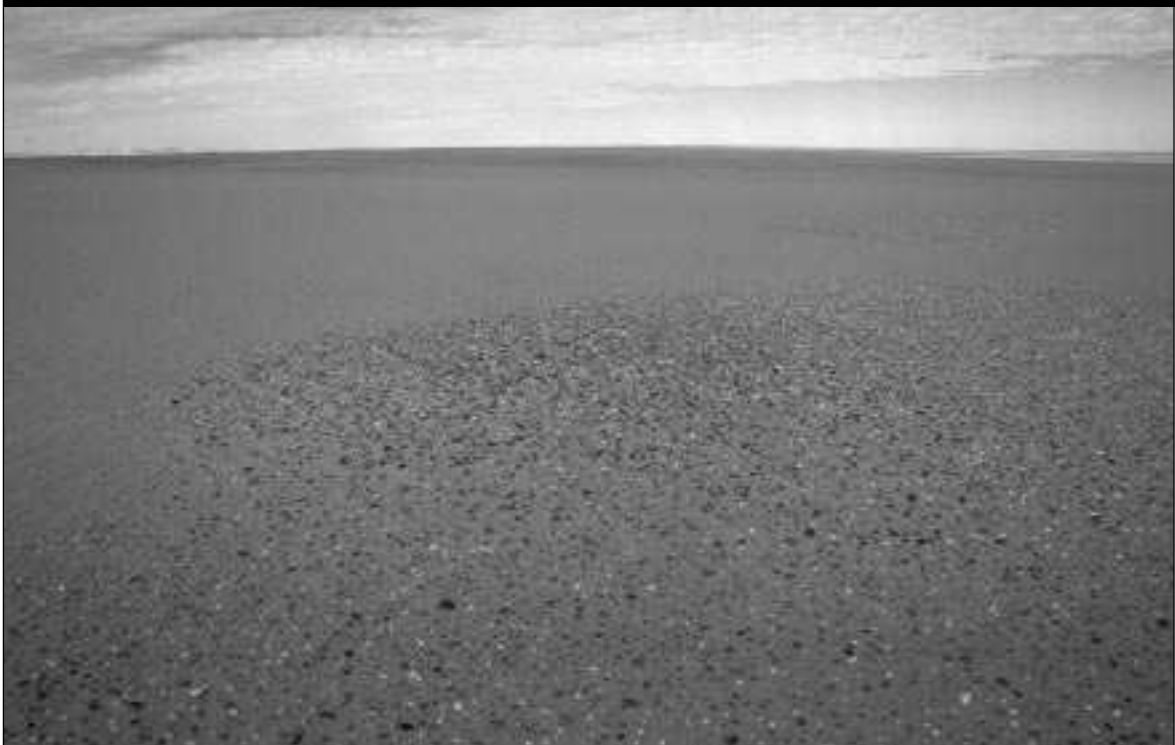
91 - Puscava Ténéré - Veliki Nic

V modificirani obliki se je tradicionalna tuareška družbena slojevitost ohranila v nekaterih regijah Malija, Nigra in Burkine Faso (Oxby, 1986: 100). Do pred nekaj desetletji so jo poljudno opisovali kot tog prežitek fevdalizma. Vendar pa moramo na to stratifikacijo gledati v kontekstu zgodovinskih družbeno-gospodarskih razmer osrednje Sahare in Sudana, kar pa še zdaleč ne opravičuje današnjega suženjstva med nigerskimi Tuaregi in tudi nekaterimi drugimi etničnimi skupinami v Nigru: Fulani, Songhaji, Tubu, Hausa in Arabci. 22