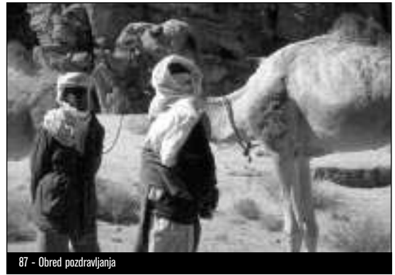
87 - Obred pozdravljanja

sorodstvene linije. Zaradi povezave več klanov v “skupini bobna” je (bil) ta v prvi teritorialna enota, saj “ne moremo govoriti o nekem unilinealnem pokolenju skupine” (Nicolaisen in Nicolaisen, II. 1997: 501). To teritorialno enoto Tuaregi še danes imenujejo tavsit , ki ji je načeloval poglavar in lastnik bobna, anastafidet , vendar je bila njegova moč omejena (Claudot-Hawad, 1993: 68–71). Različni tavsit so se združevali v prej omenjene federacije, imenan , s formaliziranimi političnimi odnosi. Na ta način so (bili) vsi prebivalci posameznih regij, ne glede na različno klanovsko pripadnost ali socialni položaj, povezani v federacijo pod vodstvom poglavarja plemiškega rodu, imenovanega amenokal . 10 Tudi ta je bil lastnik bobna, ettebel , ki je predstavljal njegovo edino insignijo. Izbrali so ga samo nekateri anastafidet plemiškega in podložniškega stanu. Politični položaj amenokala ni (bil) niti deden, niti doživljenjski (Bernus, 1981:83).