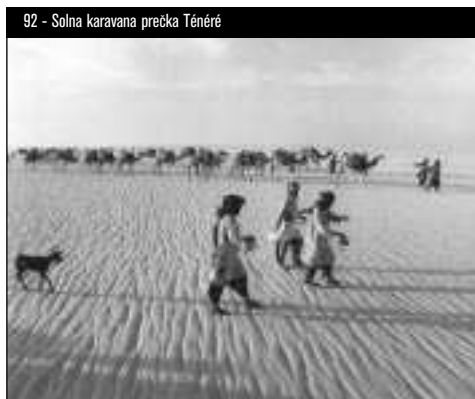
92 - Solna karavana prečka Ténéré