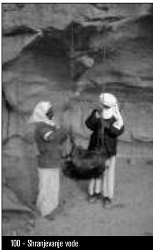
100 - Shranjevanje vode