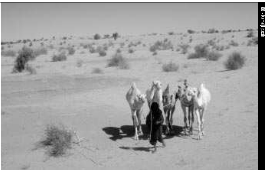
88 - Kamelji pastir

V tuareško federacijo so bili vključeni vsi tuareški stanovi. 11 Horizontalno delitev tuareške družbe večina avtorjev opredeljuje z dihotomijo svobodnih nasproti sužnjem. Na vrhu družbene lestvice svobodnih ali “pravih” Tuaregov, imuchar , kakor jim pravijo na severu, je dominirala in še vedno dominira manjšinska plemiška kasta nomadskih ihaggaren (na severu) in imajeren (na jugu), 12 ki so (bili) pogosto svetlejše polti. Čeprav naj bi šlo za pretežno endogamne skupnosti, katerih poudarek na rasni čistosti naj bi bil po nekaterih