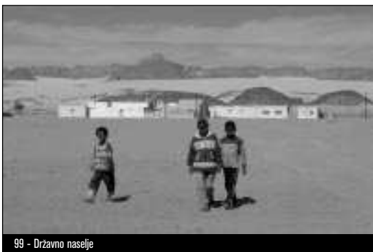
99 - Drzavno naselje