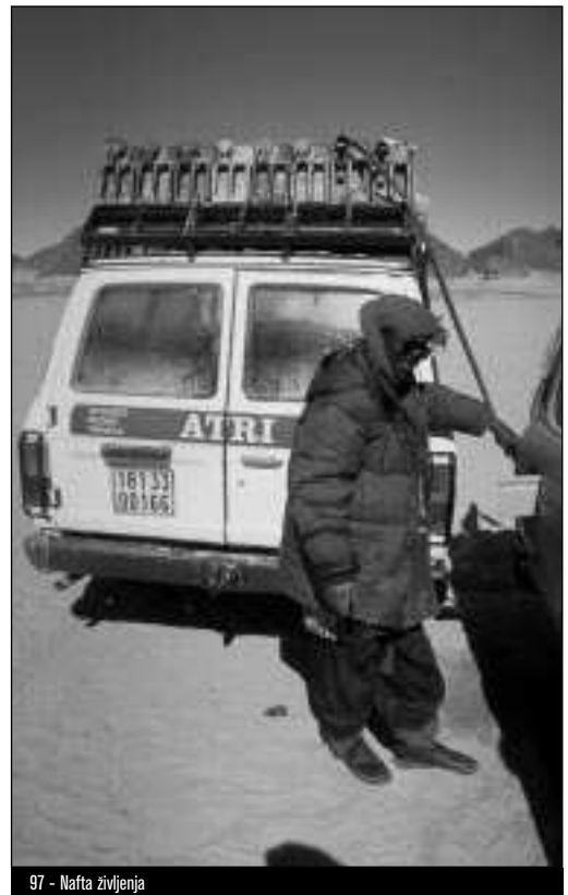
97 - Nafta življenja

Poraz pri Titu je imel za Tuarege daljnosežne posledice. Francozi so še istega leta poslali v Hogar kazensko ekspedicijo, katere namen je bil