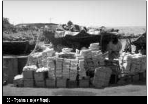
93 - Trgovina s soljo v Moptiju

Nedvoumno pomeni afriško študijsko popotovanje nemškega geografa Heinricha Bartha enega izmed največjih raziskovalnih dosežkov v afrikanistiki 19. stoletja. Ker je v Afričanih videl ljudi, se zavzemal za njihovo samostojnost in povezanost, 29 je ostala njegova vloga v zahodni javnosti 19. stoletja, v primerjavi s številnimi drugimi evropskimi rasističnimi avan-turisti, minorna. Kar se tiče Tuaregov, so bolj kot obisk in opis Timbuktuja, leta 1853, pomembni Barthovi zapisi o zgodovini migracij v osrednji Sahari, študij jezika, opisi poli-