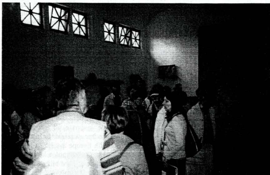
Obisk Mitreja na Ptuju

Farnemu kulturnemu društvu na Koroški Beli želimo še veliko uspehov pri bogatenju kulturnega življenja na vasi.