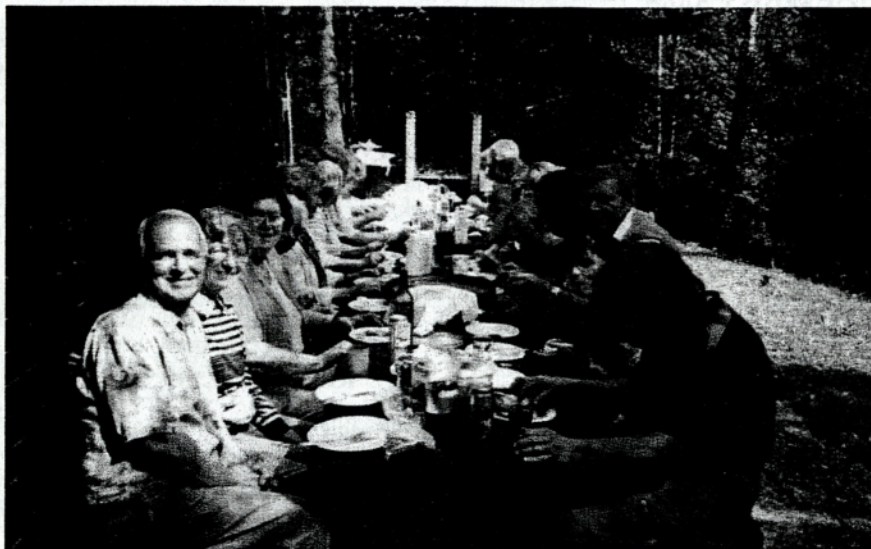
Društveni piknik na Hrušici