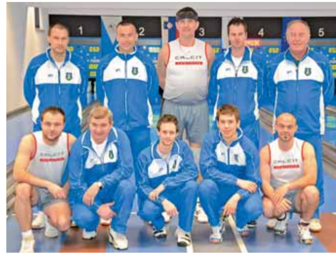
Igralci Calcita so postali četrti moški klub z naslovom prvaka Slovenije.