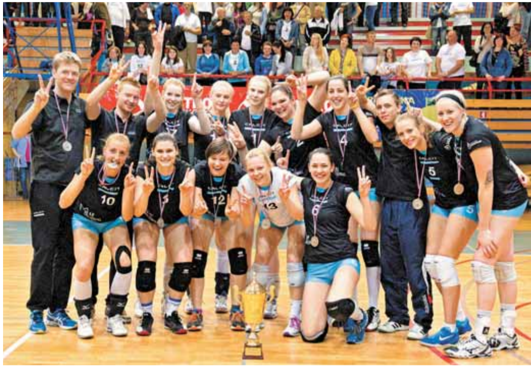
Po dveh prvih mestih v pokalu Slovenije in v srednjeevropski ligi so se morale kamniške odbojkarice v državnem prvenstvu zadovoljiti z drugim mestom.

Za odbojkarice Calcit Volleyballa se finale končnice državnega prvenstva ni izšel ravno po željah, saj so v treh tekmah morale trikrat priznati premoč Nove KBM Branik, tako da so Mariborčanke še četrti zapored prihle do naslova državnih prvakinj. Toda navkljub porazu v finalu končnice v kamniškem taboru ni razloga za slabo voljo, saj je ekipa šla v letošnje sezono popolnoma prenovljena. Nekaj podobnega velja tudi za kamniške odbojkarje, ki so po porazu s Panvito Pomgradom v polfinalu končnice zdaj v boju za končno tretje mesto. Na prvi tekmi so v domači dvorani premagali Salonit.