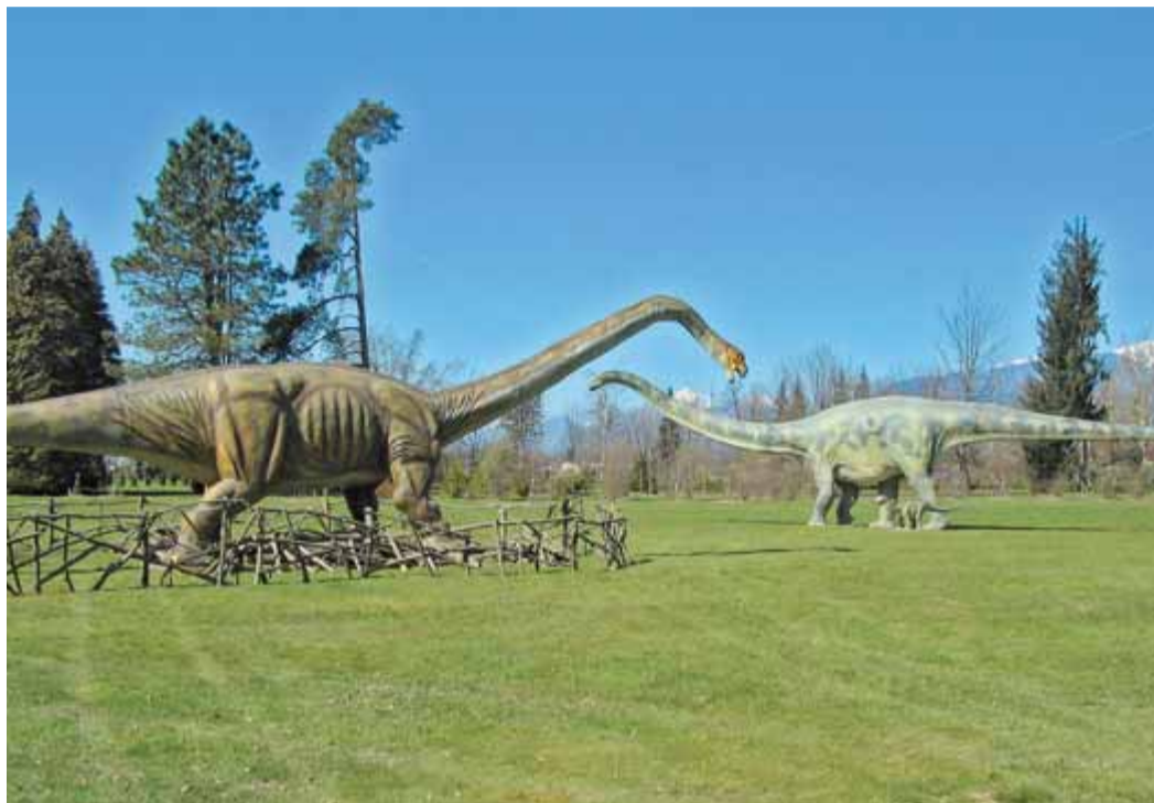
Pred štirimi leti so v Arboretum prvič pripeljali dinozavre. Odziv obiskovalcev je bil fantastičen, zato so se dinozavri letos vrnili. Gre za največjo razstavo dinozavrov v Sloveniji, saj je v parku postavljenih kar 65 dinozavrov, nekateri med njimi celo premikajo glavo in rep, dihajo, obračajo oči in spuščajo zvoke. Največja med njimi sta s 25 metri Brahiozaver – »Rokatec« in Mamenchiozaver – »Mamenški kuščar«.