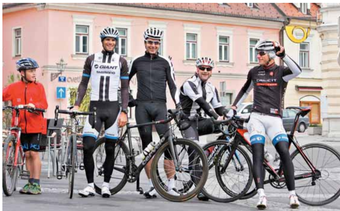
Ko je Luka doma, gre z veseljem na rundo s prijatelji, nekateri pa so tudi njegovi trening partnerji.

Jasno, več kilogramov kot imam, bolj trpim na klanec. Če jih imam 71, kar je moja spodnja optimalna meja, kot sem ugotovil skozi leta, v sprintu nisem več tako eksploziven. Torej je treba najti ravnovesje. Če je trasa dirke zelo zahtevna in težka, je bolje, da imam manj kilogramov in lažje pripeljem čez klanec in sprintam manj izmučen. Če pa sem težji, na koncu v zadnjih metrih lahko dam več od sebe. Sedaj jih imam 73, pred italijanskim Girom v maju, ki bo poleg aprilске Romandije moja naslednja velika preizkušnja, pa jih bom verjetno imel 72. Ko sem bil še gorski kolesar, je bilo idealno okoli 71. S temi kilogrami nisem bil med lahkimi. Če bi bil po specialnosti hribolazec, bi jih imel manj. Hribolazci morajo več in časovno dlje trenirati ter manj jesti. Mi sprinterji pa manj treniramo in več jemo. Moramo biti spočiti, pomembna je svežina. Če si utrujen, preprosto nisi eksploziven.