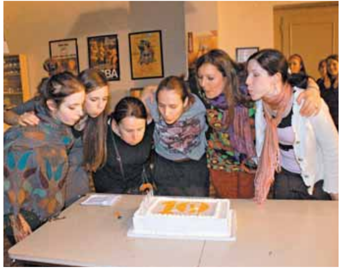
Ustanoviteljice društva KUOD Bayani in plesne učiteljice ob rojstnodnevni torti.