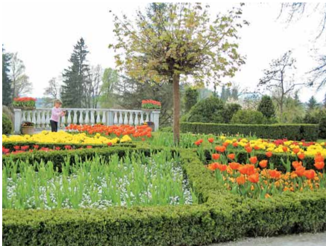
Pomlad nam postreže z obilico cvetja. Med sprehodom po Arboretumu nam pogledi zastanejo ob čudovitih barvah mnogih cvetic, med katerimi so najbolj znameniti tulipani.

večino stroškov letošnje sanacije bodo skušali pokriti z razstavami in dogodki, pri tem naj bi jim pomagala zanimiva razstava dinozavrov, ki so jih v park postavili že konec marca. Vse do 10. junija bo obiskovalce, še posebej pa mlade družine, privabljalo 65 dinozavrov, med njimi je osem premikajočih, največji med njimi pa meri 25 metrov.