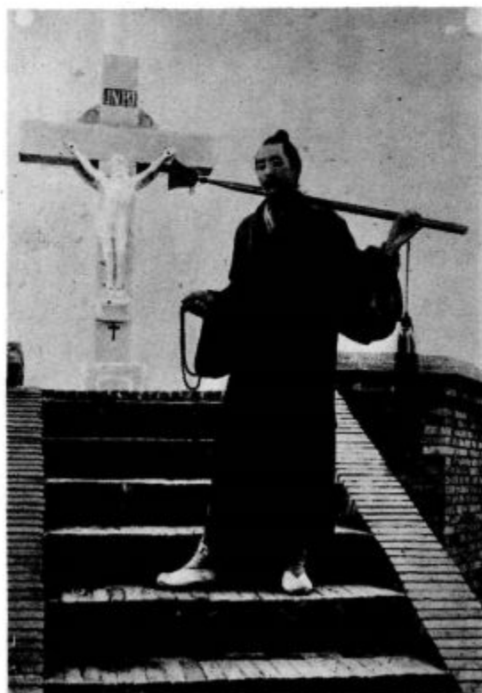
Izpreobrnjeni kitajski duhovnik

Gorečnost vernikov za slavo božjo v nekaterih krajih Avstrije je omogočila, da so v kratkem času pozidali prav lepe cerkve: Opeko za cerkev na Hungersbergu blizu Innsbrucka, ki je posvečena sv. Tereziji Det. J., so znesli na stavbišče verniki v posebnih nosilih. Razdeljeni so bili v več skupin. — V kraju Sieding (Niž. Avstr.) je bila nedavno posvečena cerkev. Sezidana je bila tako, da so ondotni verniki pomagali brezplačno pri stavbi in sicer vsega skupaj 20.000 delovnih ur.