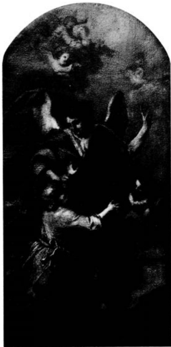
Sv. Jakob v Ljubljani Angel varuh

zrastlo. V teh dečkih, ki so svetlih oči in veselih src obkrožali zastavo čistega in dobrega, skoraj nisem mogel spoznati naših gimnazijcev. Sveta božja moč, kipeča veselost in zvesta skupnost je ležala kakor zlato solnce nad četo.