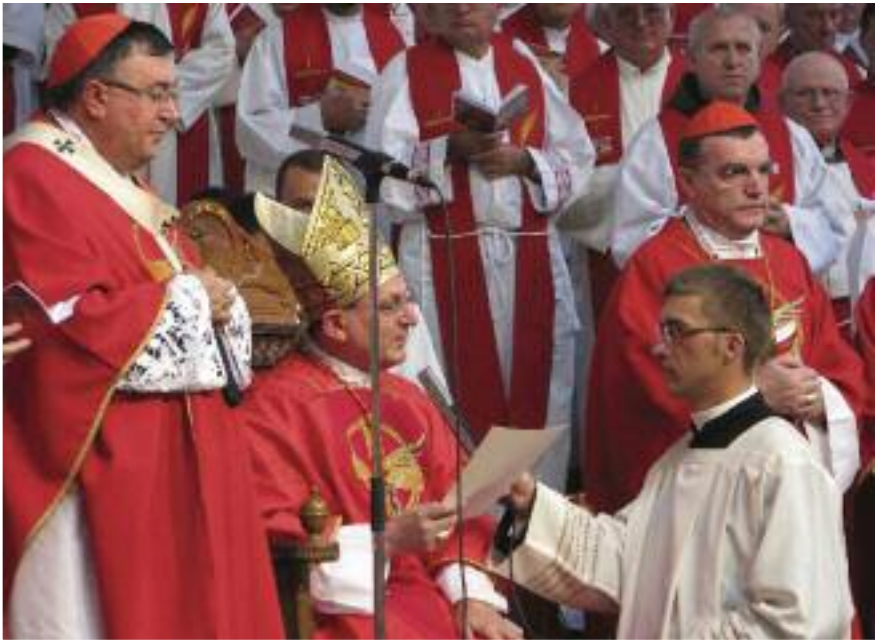
Kardinal Angelo Amato med razglasitvijo blaženih mučenk