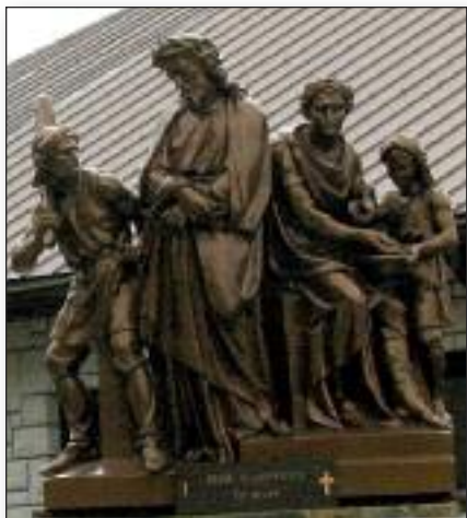
Križev pot v Midlandu, 1. postaja

njihove vere. Njihova kri ne vpije po maščevanju, temveč po iskreni spravi z Bogom in med rojaki. Kri mučencev naj bi bila seme za novo versko in narodno pomlad v Sloveniji ter povsod, ker biva naš slovenski rod.