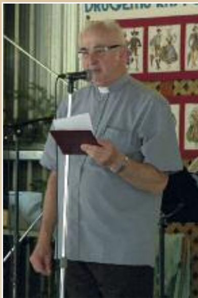
G. Jože Zupančič CM

Jezus sam je postal 'solidaren' z nami, postal nam je enak, postal je ubog, da bi mi po njem obogateli v dobroti, ljubezni, pravičnosti in solidarnosti.