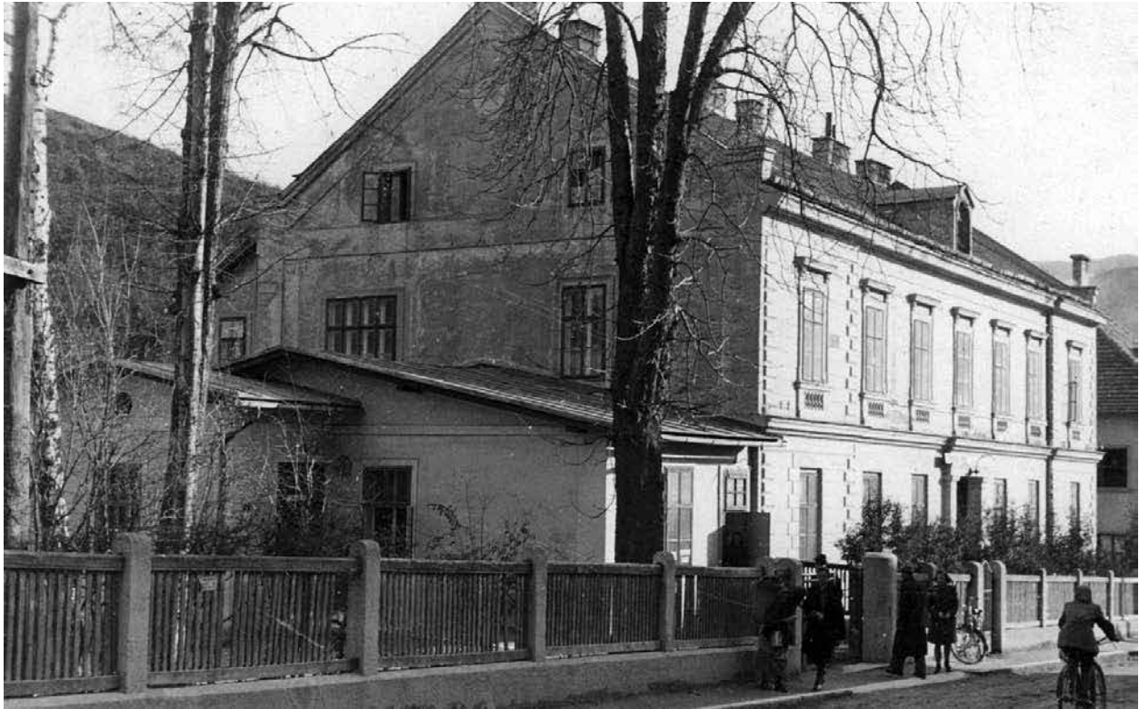
Fotografija stare bolnice oz. ambulantnega poslopja v Trbovljah, 1926.

Poslopje je bilo zgrajeno v letih 1871 in 1872. Do novembra 1925 je služilo kot bolnišnica, ki je imela 40 postelj. V letu 1926 so stavbo adaptirali in zgradili prizidek na severni strani.