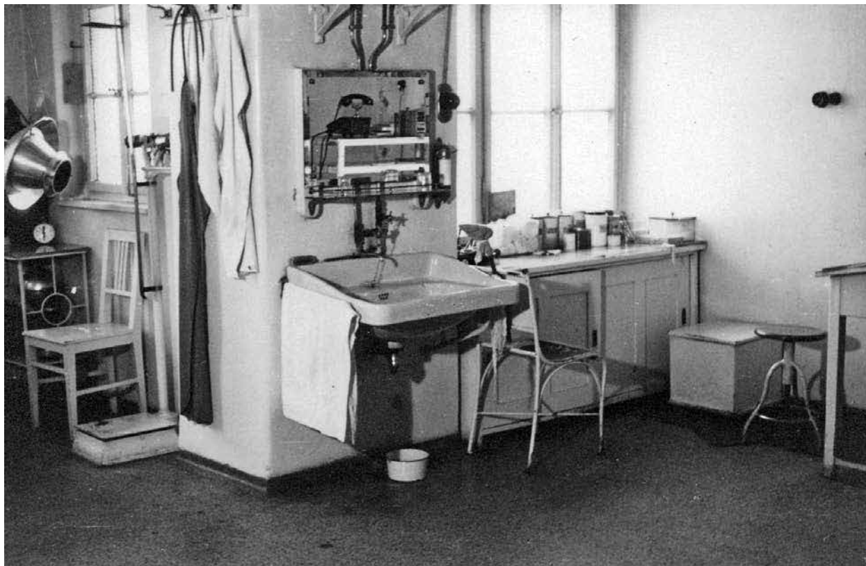
Fotografija ordinacije v ambulantnem poslopu, 1926.