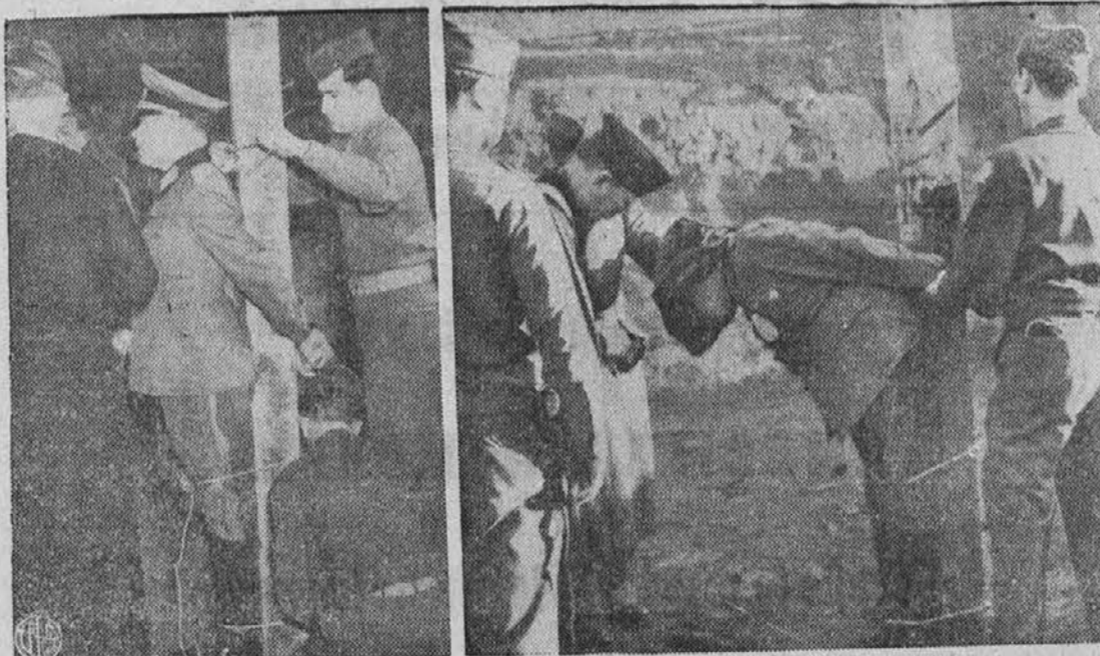
Izvršitev smrtne obsodbe. — Gornja slika nam kaže, kako je plačal nemški general Anton Dostler, za svoje vojne zločine. Usmrtitev je bila izvršena v Averesa v Italiji. Obsojen je bil, ker je dal ustreliti 15 ameriških vojakov, ki so bili zajeti za nemškimi linijami v Italiji v marecu 1944.