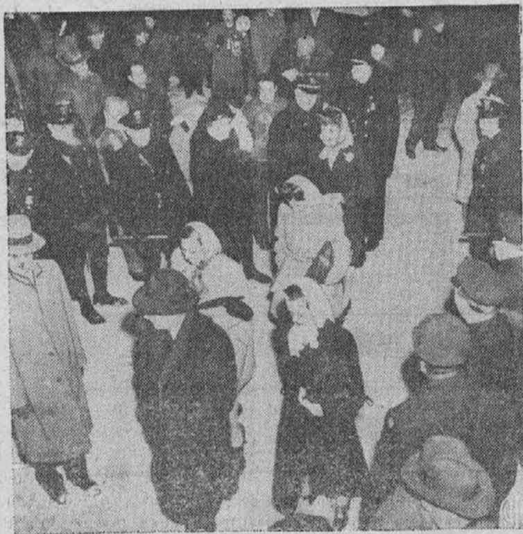
Na stavki pri General Motors Co. v Flint, Mich. je policija prodira skozi piketne vrste, da so mogli prisilskimi uslužbenci na delo. Slika nam kaže nekaj teh delavcev pri vstopu v tovarno medtem, ko policija stoji na straži.