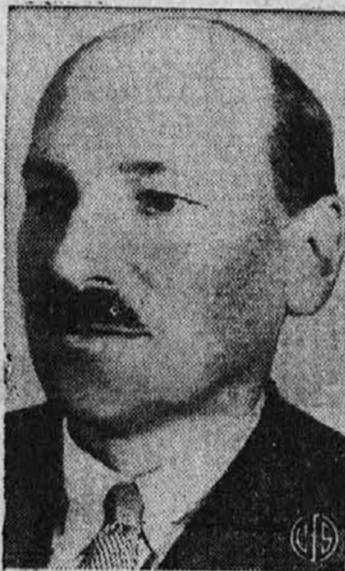
Pri volčvah 26. julija 1945 so Angleži krenili na levo in nadomestili konservativnega premierja Churchill-a z delavskim voditeljem Clement Attleejem, katerega nam kaže gornja slika in ki je sedanji premier Velike Britanije.