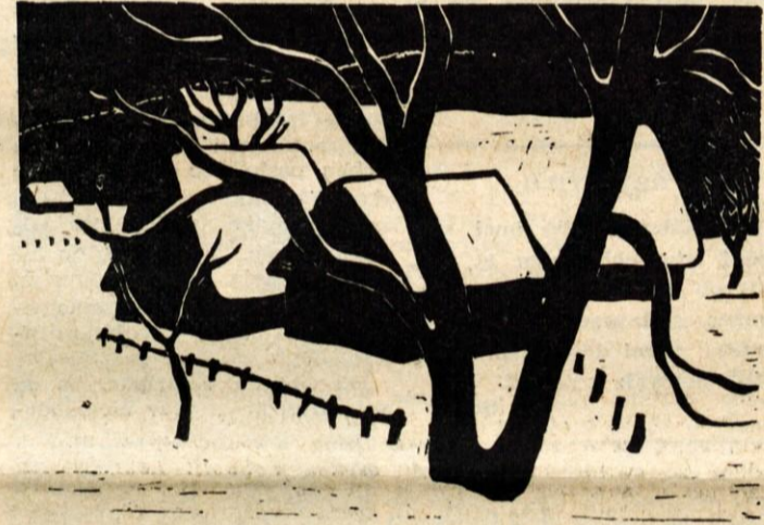
Na sliki: eden najboljših lesorezov Wernerja Berga »Zimski večer«

karjev. Nekateri sicer menijo, da igra grafika v tej deželi le stransko vlogo in da ima, z izjemo nekaterih umetnikov, ki se posvečajo izključno tej panogi, zlasti lesorezov, samo ne-