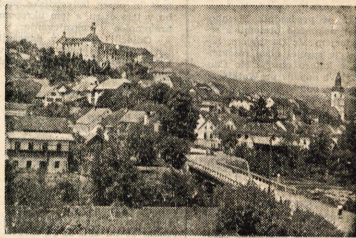
Od 12. do 19. decembra bodo Škofjeločani praznovali svoj drugi občinski praznik.

Ob zaključku seje so odborniki sprejeli odlok o konstituiranju novega časopisnega, založniškega in tiskarskega podjetja »Gorenjski tisk«, v katerem sta se združili dosedanja podjetja »Glas Gorenjske« in »Gorenjska tiskarna«.