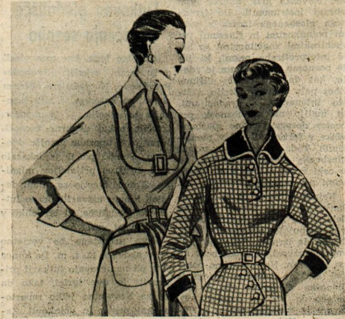
Ljubka modela za dnevne obleke. Karirasto lepo dopolnjuje temnomoder žametast ovratnik, obrobjen z belo svilo in pa manšete iz enakega materiala. Obleko na levi pa krasi našitek na životcu in nekaj nezalikanih gub med obema žepoma.

2. Lahko pa napravite dobro lepilo tudi na tale način: jajčne beljake pomešajte s steklenim prahom do potrebne gostote. Stekljeni prah dobite, če delček stekla močno segrejete in ga takoj zatem spustite v mrzlo vodo. Stoklo v njej razpade na kose, ki so zelo krhki in jih zlahka stolčete v prah. Iz dobljenega prahu in beljakov pripravite lepljivo kašo, s katero namažite dobro umite in posušene dele porcelanaste posode na prelomljenih delih in jih zlepite ter pustite stati toliko časa, da se dobro sprimejo.