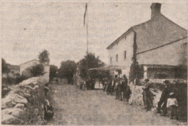
Pozdrav iz Trebič

Zdi se mi primerno nuditi bralcem našega dnevnika nekaj kamenčkov iz nenavadnega mozaika, ki sem ga komal začel sestavljati; zatorej za začetek drobtinica »za pokušino«, ki silijo k razmišljanju, o priložnosti pa še kakšna. F. F.