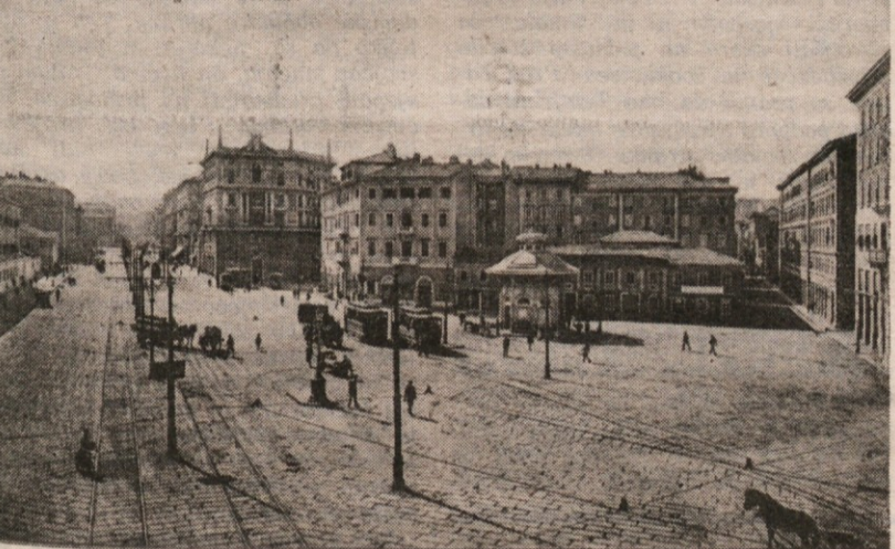
Trieste - Piazza Guglielmo Oberdan

Razglednica je iz časov po prvi vojni (1924), sicer pa je očitno, da je kliše starejši. Zakaj? Ker je pač na desnem robu razglednice videti kos neosmojenega Balkana, ki pa je zgorel kmalu po prihodu Italije (13. 7. 1920)