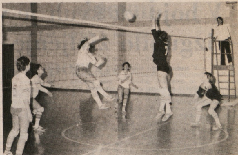
Pri naši okrogli mizi je bil govor tudi o mladinski ekipi Friulexport. Na sliki: združena ekipa (v svetlih dresih) v slovenskem derbiju proti Bregu v okviru finalnega srečanja za pokrajinski naslov deklic

SUŠTERŠIČ: «Mogoče je razlog tudi v tem, da igralke diktirajo trenerju, koliko treningov naj imajo. Če bi trener imel na razpolago večje število kvalitetnih igralcev, bi v