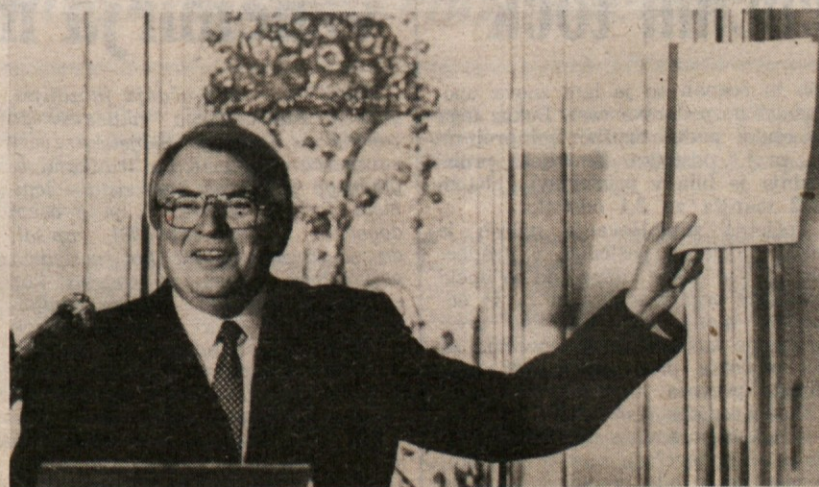
Premier Mauray obtožuje Barrea in Giscarda D'Estainga

PARIZ — Nekdanji predsednik francoske vlade Barre je zanikal, da bi bil na kakršenkoli način vpleten v zadevo «Elf-Aquitaine» ter izrazil prepričanje, da gre za politični manevar, ki so ga uprizorili njegovi nasprotniki.