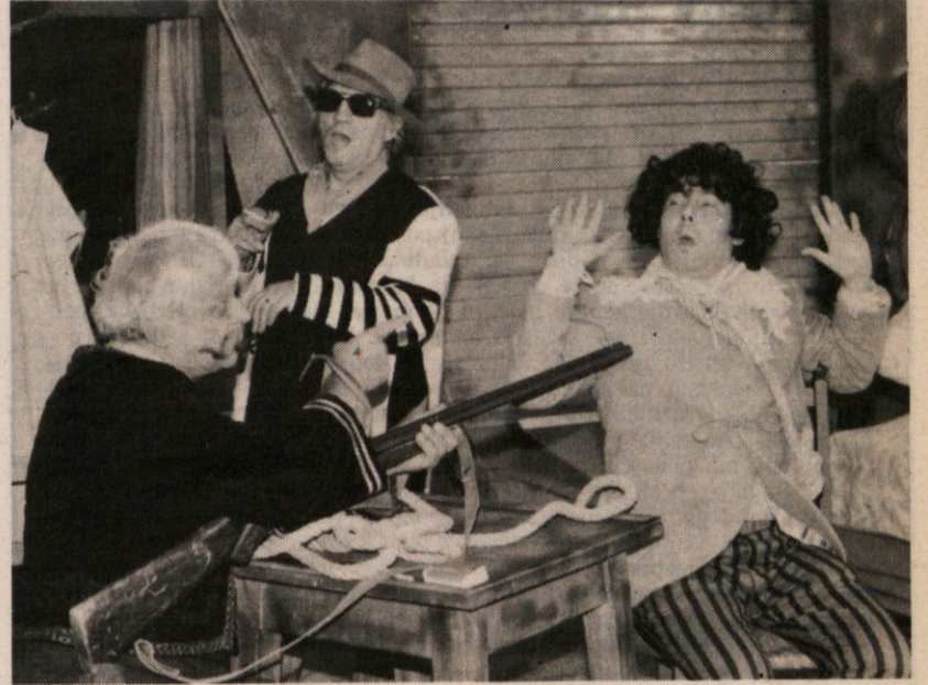
Po uspešni premieri v Gorici bo ansambel Slovenskega stalnega gledališča odigral tudi v Kulturnem domu v Trstu bridko komedijo o samoizda-

ji Radovan Tretji srbskega avtorja Dušana Kovačeviča. Od petka dalje sji bo torej lahko tudi tržaška publika ogledala že tretjo postavitev našega gledališča v letošnji sezoni, zgodbo o nori družini Radovana Tretjega, ki živi v dvanajstem nadstropju neke stolpnice, kjer se dogaja vse mogoče, v prvi vrsti pa boj s sosedi Vilotiči, ki so Radovam onečastili hčerko Georgino.