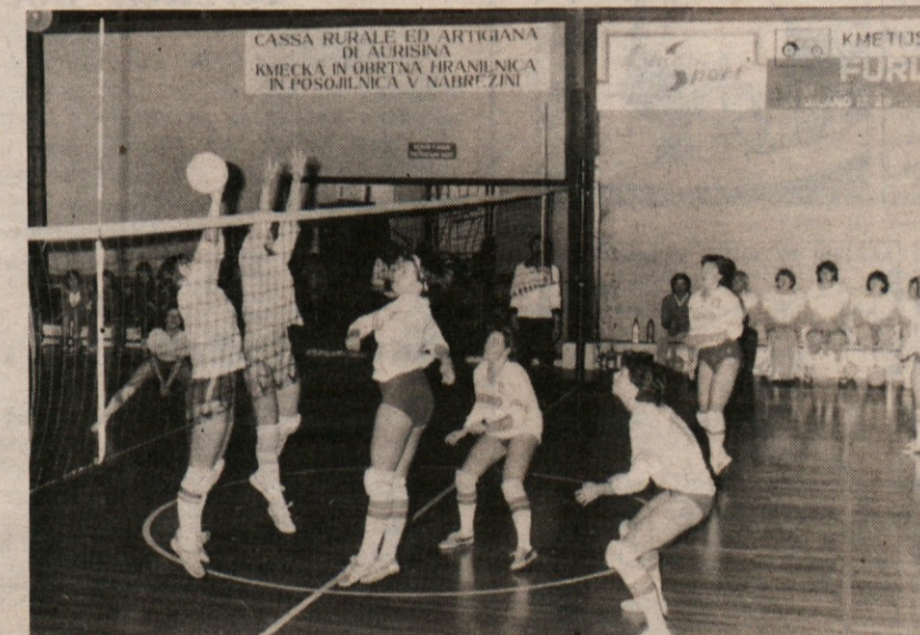
Odbojkarice Mebla med prvenstveno tekmo proti ekipi Volley Club iz Conegliana. Na sliki: naše predstavnice v napadu

PETERLIN: «Vsako soočenje je koristno. Ker smo se dotaknili tako široke problematike, je prav, da po tej poti nadaljujemo, mogoče že februarja, ko bo ZSSDI izdelalo podrobno analizo o demografskem stanju na Tržaškem. V odbojarskem svetu ni novost, da se sestajamo in razpravljamo. Pred dvema letoma smo imeli posvet o odbojki. Ugotavljam, da se težnje sedaj popolnoma razlikujejo od takratnih. To pomeni, da je naša odbojka v bistveni evoluciji. Ta, kot tudi druge okrogle mize bo prav gotovo imela širši odmev v javnosti in upam v pozitivnem smislu.»