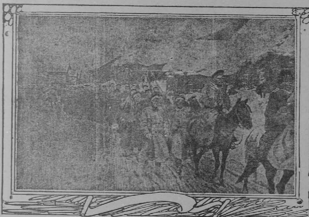
RUSKI VOJAKI NA POTU V BITKO.

Petrograd, 17. okt. Vojno ministerstvo je dobilo uradna poročila z današnjim datumom, ktera javljajo, da se je bitka južno od Mukdena danes zjutraj zopet pričela. Japonci ne morejo prepoditi Rusov od desnega brega reke Shaka. Boji pri ruskem levem krilu so postali slabejši in na desnem krilu, kjer Japonci še vedno zamašajo rusko središče prodrati ter tako priti v posest železnice, trajajo še vedno dalje vroci