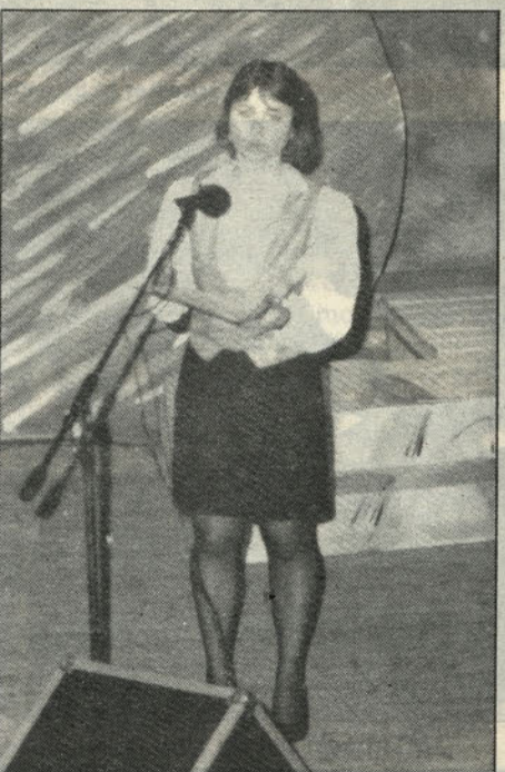
Mezzosopranistka Cvetka Kopač.