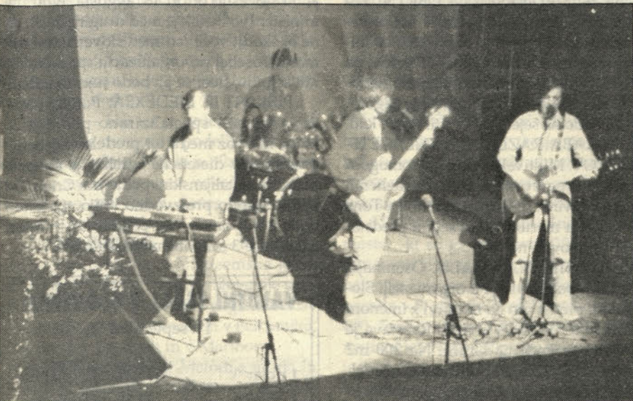
Orkester „Rock & Polka“.