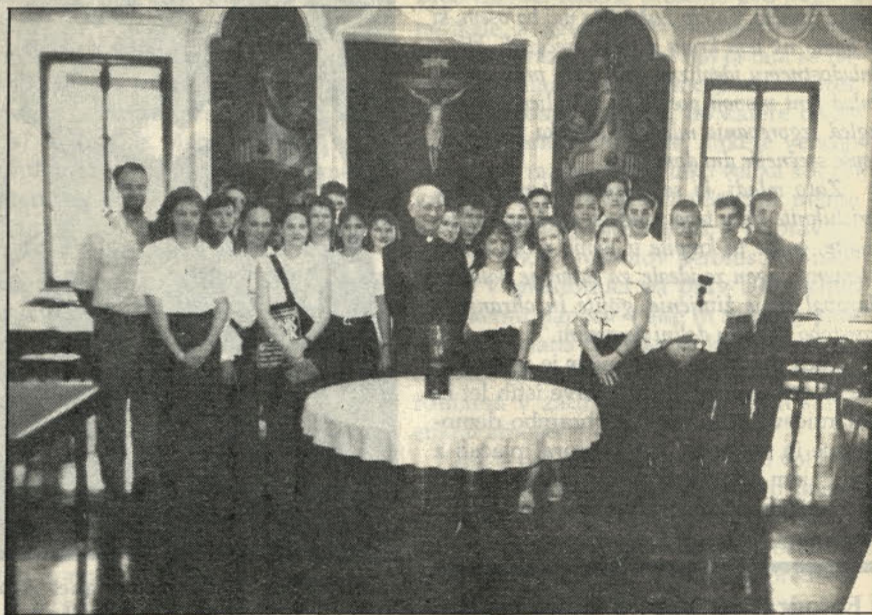
Sprejem pri nadškofu dr. Alojziju Šuštarju.