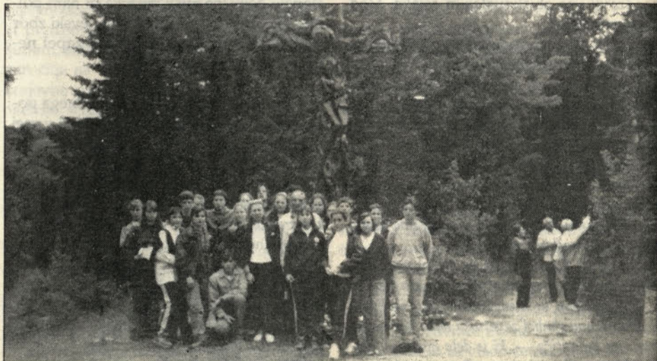
Ob križu pri jamah v Kočevskem Rogu.