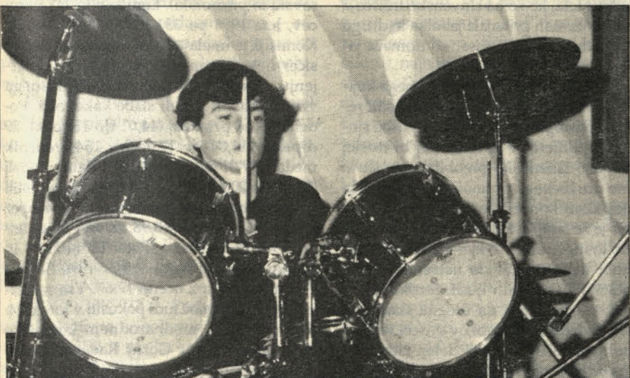
Tone Vivod igra na tolkala.