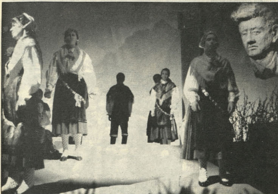
Recitatorke in recitatorji Balantičevih pesmi v režiji Frida Beznika.