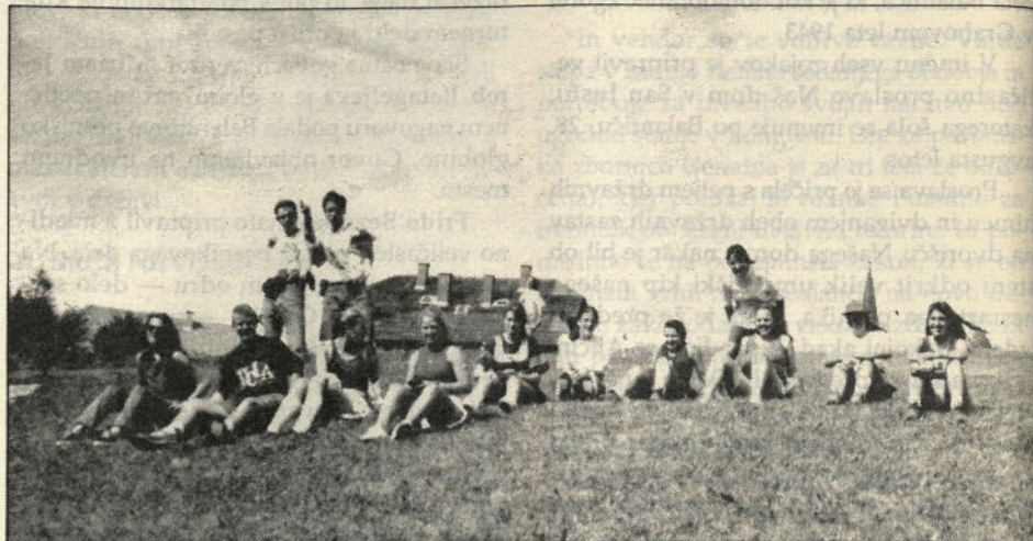
Rast XXII pri Sv. Primožu na Pohorju.

To naše potovanje bo zmeraj globoko v spominu, ker je bilo zelo važno v mojem življenju. Zavedam se, da sem tudi Slovenka, da je Slovenija tudi moja dežela.