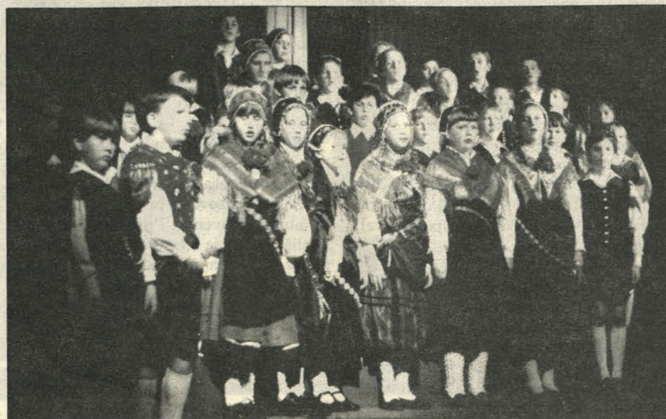
Šolarji Balantičeve šole med zborna recitacijo