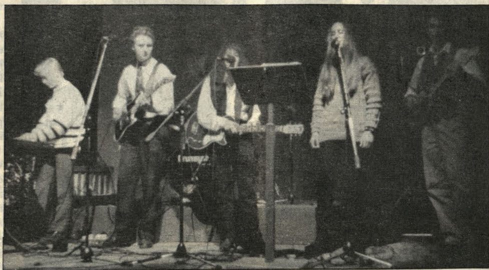
Orkester iz Slovenske vasi v Lanusu.