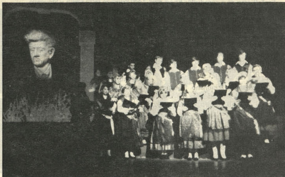
Mladinski pevski zbor na odru pred sceno, delo Toneta Oblaka.