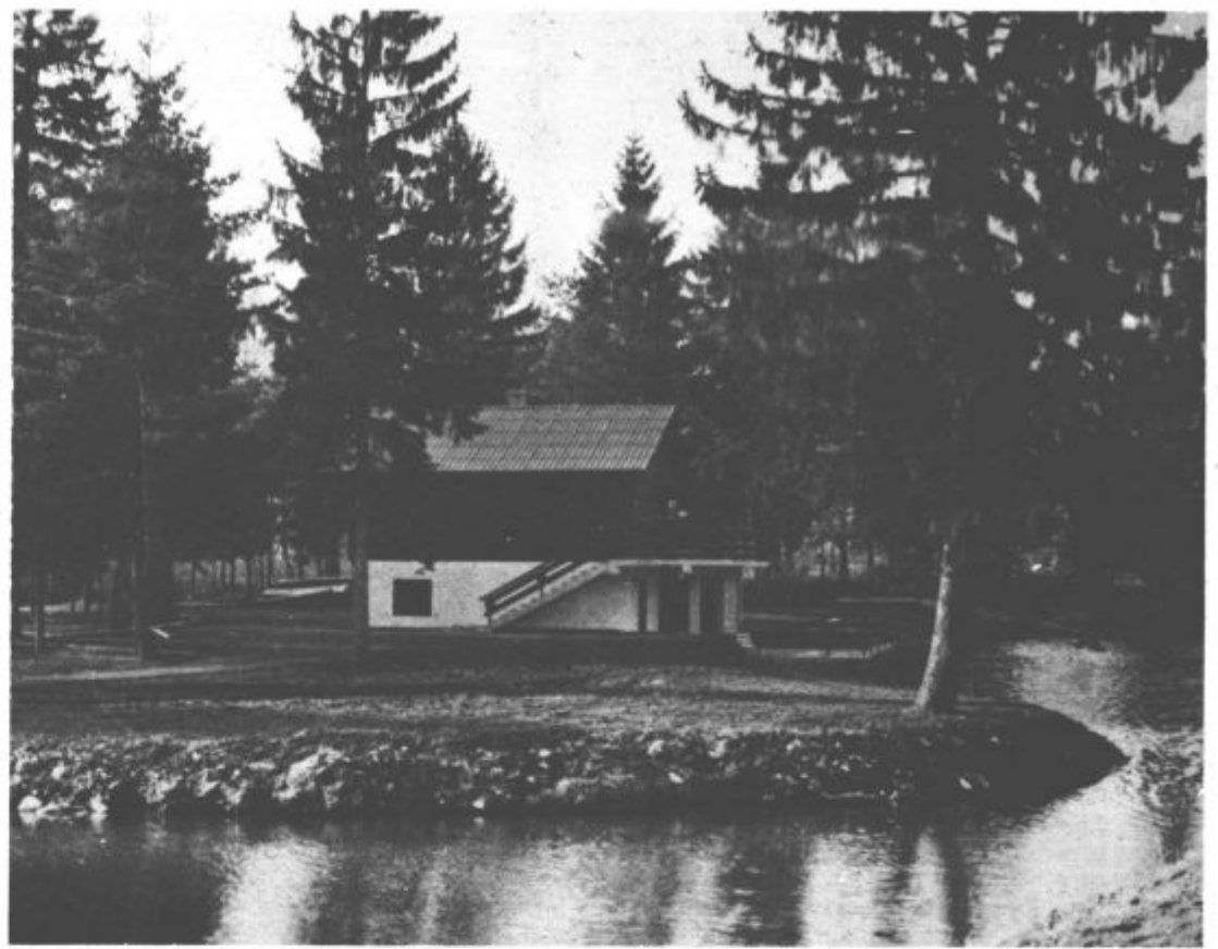
Ribiški dom – zametek in začetek gaja