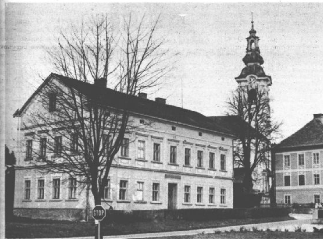
Doklej še hiša negotovosti?

in avtobusna postaja, ki za prometno varnost ni povsem brez pomena. Problem so tudi telefonske številke. Mozirje se hitro širi, želja je veliko, številke pa nobene več, pa še obeti za v prihodnje ni-