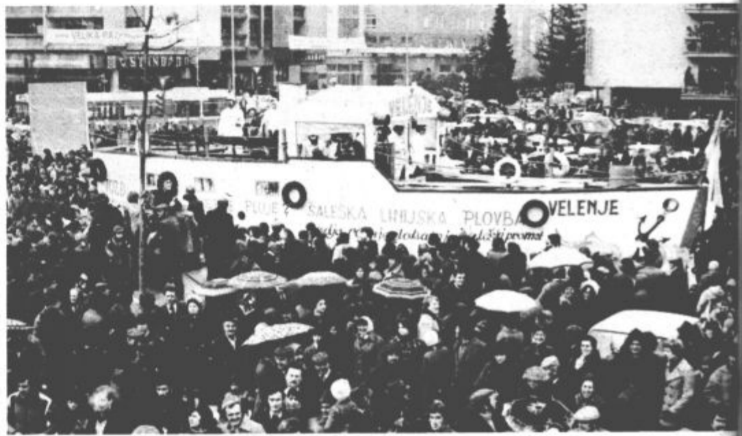
Velikanska ladja Velenje je skoraj nasedla v množici gledalcev