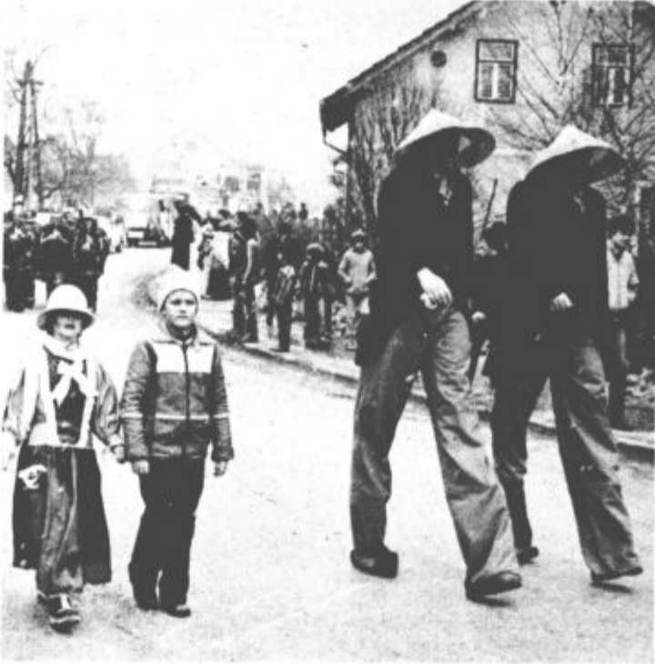
Le kdaj bova tako velika ?