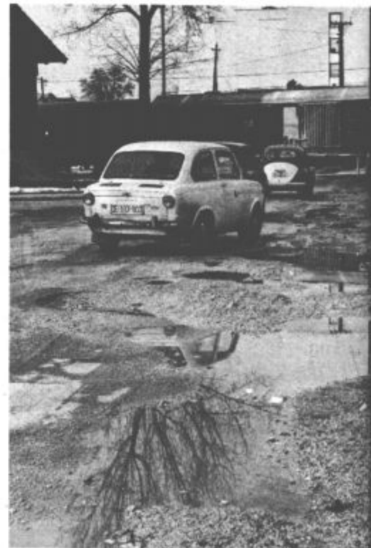
Sneg je izginil s cestišč, pojavile pa so se grozeče luknje, ki povzročajo voznikom nemalo hudobno kri pa tudi poškodb na avtomobilih. Takole „zacvetela“ Celjska cesta v Velenju.