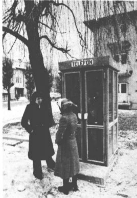
Ob tržnici v krajevni skupnosti Velenje center - Desni breg so pred dnevi postavili prvo javno telefonsko govornico v Velenju.