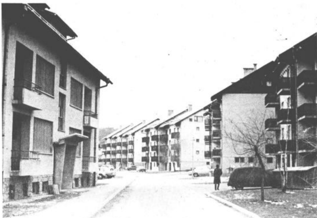
Za družbena stanovanja ni več prostora

Tudi planinci segajo s svojim društvom še v prejšnje stoletje. Danes šteje društvo dobrih 400 aktivnih članov. V Savinjskem gaju so zgradili lep bivač, prirejajo izlete širom po ožji in širši domovini, s predavanji in drugimi izobraževalnimi oblikami pa širijo krog ljubiteljev naših