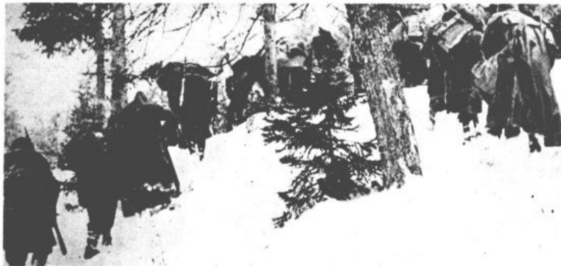
XIV. divizija na Graški gori 21. februarja 1944. (slika zgoraj in spodaj)