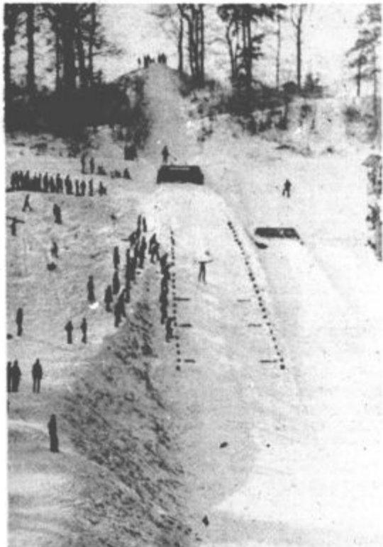
Na velenjski smučarski skakalnici so se preteklo nedeljo pomerili starejši pionirji za republiške naslove. Več o tekmovanju na športni strani.