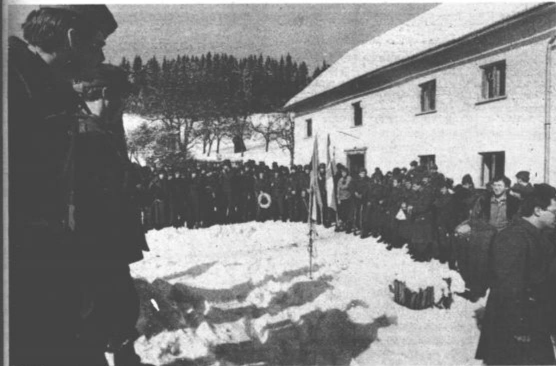
Pohodniki so se zbrali pred Žlebnikovo domačijo