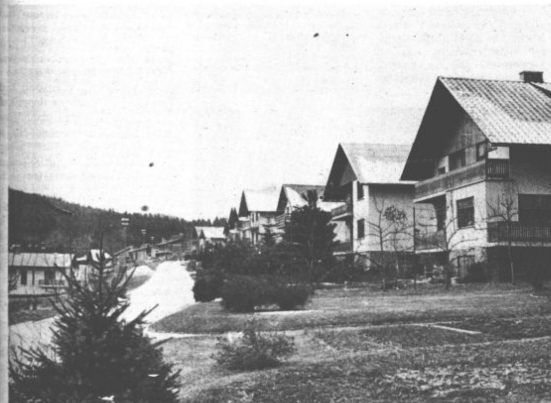
Čeprav pozimi, je skrb za okolje čutiti na (skoraj) vsakem koraku