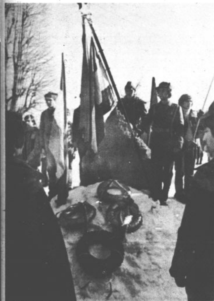
K spomeniku Karla Destovnika — Kajuha so mladi položili vence

Pri občinski konferenci ZSMS Velenje so pohod pozitivno ocenili, vendar so mnenja, da je v naslednjih letih potrebno pohod organizirati nekoliko drugače, če bo to še naprej republiška akcija. Pot je bila prenaporna, poleg tega pa so bili številni mladi prikrajšani, ker se pohoda zaradi omejitve števila pohodnikov niso mogli udeležiti.