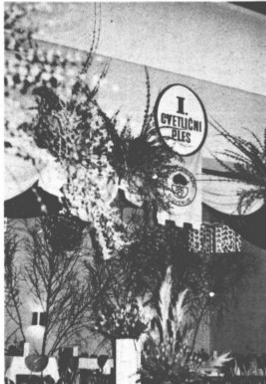
Pred dnevi je Društvo vrtnarjev Slovenije pripravilo v Mozirju prvi cvetlični ples. V domu TVD partizan so takole izvorno uredili dvorano.