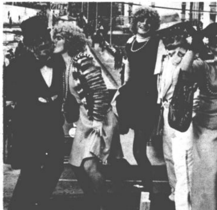
Vodenje karnavala je bilo v spretnih rokah