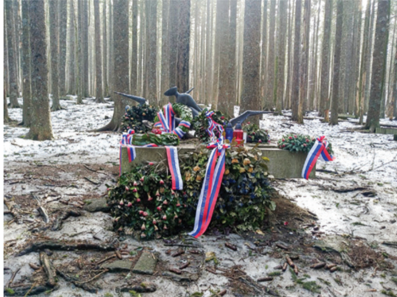
Kraj poslednjega boja Pohorskega bataljona je bil leta 2014 razglašen za kulturni spomenik državnega pomena.

Na spominski tabli nekoliko pred osrednjim spomenikom je zapisano: »Pohorski bataljon je s svojimi akcijami povzročal Nemcem precejšnje težave, zato so ga želeli za vsako ceno uničiti. V prvih dneh leta 1943 so vo-