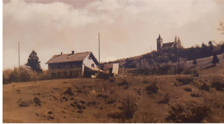
Planinski dom na Polževem, v ozadju cerkev Sv. Duha leta 1935

Zbor bataljona je bil nato 12. junija 1942 v Zapotoku. Postrojeno moštvo je v dveh četah štelo sto borcev in bolničarko, ki je na čelu