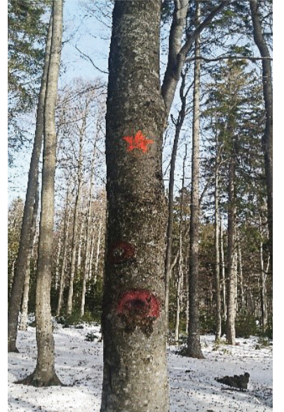
Na spodnjem delu debla je prebarvana in izpraskana zvezda, zgoraj, višje, zunaj dosega zlobnih rok, na novo narisana zvezda

Mladi za vrednote NOB so v izjavi za javnost 26. februarja ostro obsodili vsakršno uničevanje spominskih obeležij narodnoosvobodilnega boja in vsakršne poskuse potvarjanja zgodovine. Želja po svobodi, resnici, tovarštvu in miru je želja vseh razumnih ljudi in presega meje Slovenije, je internacio-