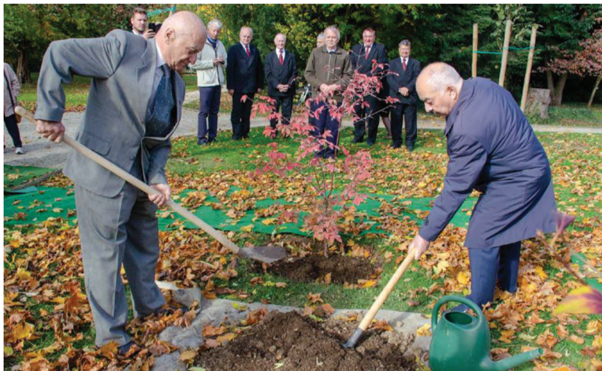
V Parku v Petanjcih so oktobra 2019 posadili tudi sivi javor v spomin padlim vojakom Rdeče armade.