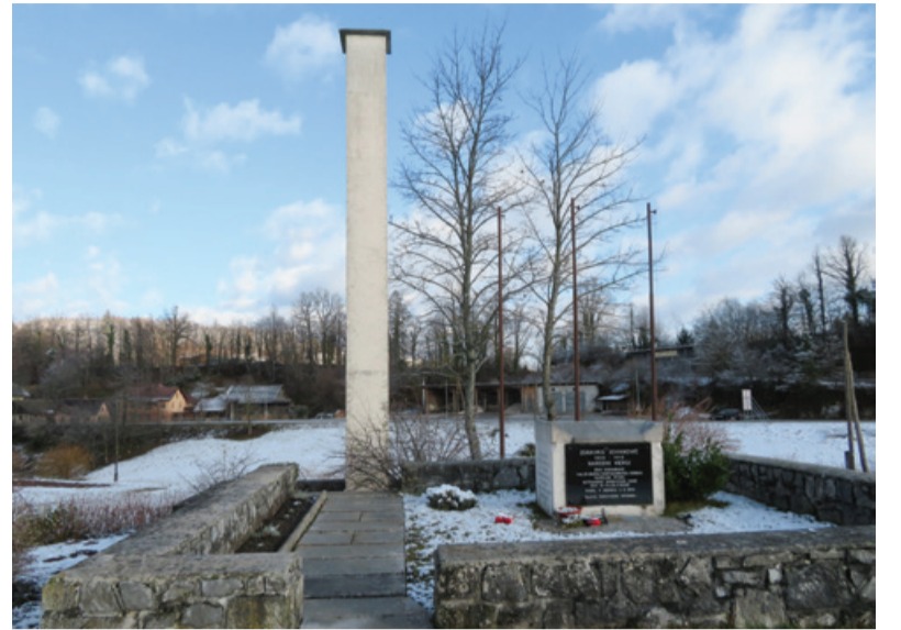
Spomenik na Turjaku

Za nadaljevanje proti Turjaku gremo od Doma na Kureščku kratak čas po cesti in nato zavijemo levo na travniški kolovoz, ki se ob zgornjem robu travnika spusti v gozd. Kolovoz se spušča po bukovem gozdu in nas v 20 minutah pripelje na asfaltirano cesto, po kateri pridemo v bližnje gručasto naselje Zapotok, kjer si lahko ogledamo tri spominske plošče: eno so vzdali krajanji v spomin na padle borce in žrtve fašizma iz tega kraja, na drugi piše, da je bil 12. junija 1942 tam ustanovljen 1. proletarski bataljon narodnega heroja Toneta Tomšiča, na tretji pa, da je v Zapotoku in okolici v letih 1943 in 1944 delovala kurirska postaja TV-10a. Italijani so 19. marca 1943 vas požgali, vendar je bila takoj po vojni obnovljena.