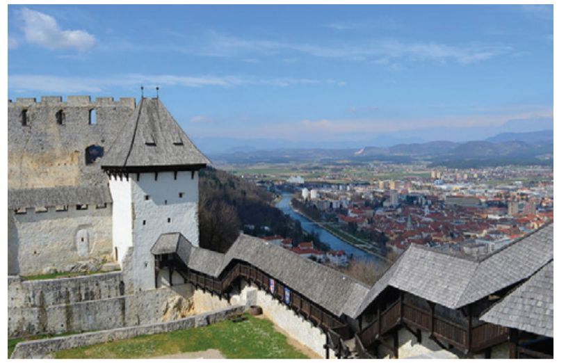
Celjski grad

Celotno slovensko ozemlje in prebivalce pa je prav v tistem obdobju začela združevati tudi nevarnost turških vpadov. Turki oziroma Osmani so v 15. stoletju zavzeli velik del Balkanskega polotoka in leta 1453 po padcu Carigrada tudi celotno Bizantinsko cesarstvo. Prvič so se Turki na našem ozemlju pojavili leta 1408 v Beli krajini, nato pa so k nam vdirali še več kot naslednjih dvesto let, njihovi napadi pa so bili najpogostejši konec 15. in v 16. stoletju. Turški napadi so bili predvsem roparski pohodi, ki so imeli namen ropati premoženje in loviti