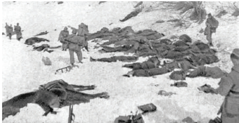
Mrtvi partizani na Javorovici

Tu se je že precej časa zadrževal IV. bataljon »Cankarjeve brigade«. 16. marca ob enih po polnoči pa je odšla iz Novega mesta skupina domobrancev, da s to komunistično tolpo obračuna. Med potjo je bila razpostavljena komunistična zaseda, ki so jo pa domobranci naglo uničili. Komunisti so obležali po grmovju. Okrog devetih dopoldne se je domobrancem v spretnem manevru posrečilo na Javorovici obkoliti komunistično tolpo in odpreti nanjo ogenj. Obroč je bil tako hitro sklenjen, da se komunisti niti niso zavedeli, kaj se z njimi dogaja. Ko so se ob prvem presenečenju zbrali, so skušali zasesti položaje in se prebiti. Toda bilo je že prepozno. Kdor se je skušal prebiti skozi obroč, je obležal v grmovju ali v kotanji. Kmalu so komunistični mrličji ležali vse naokrog po hosti. Eden se je