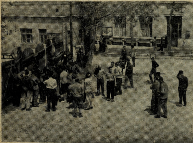
13. 6. 1964 ob 13.40 pred izhodom iz tovarne