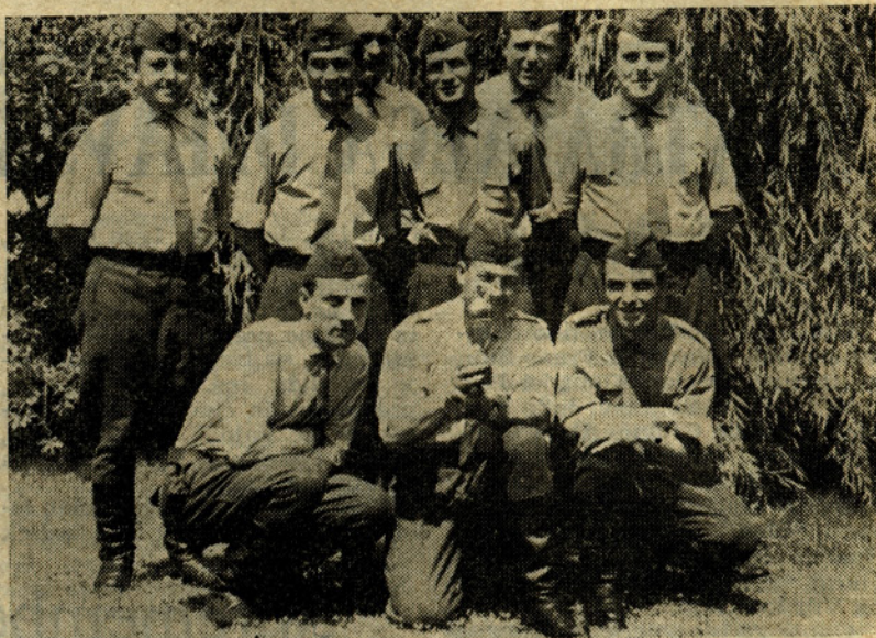
Zmagovita ekipa naših gasilcev.