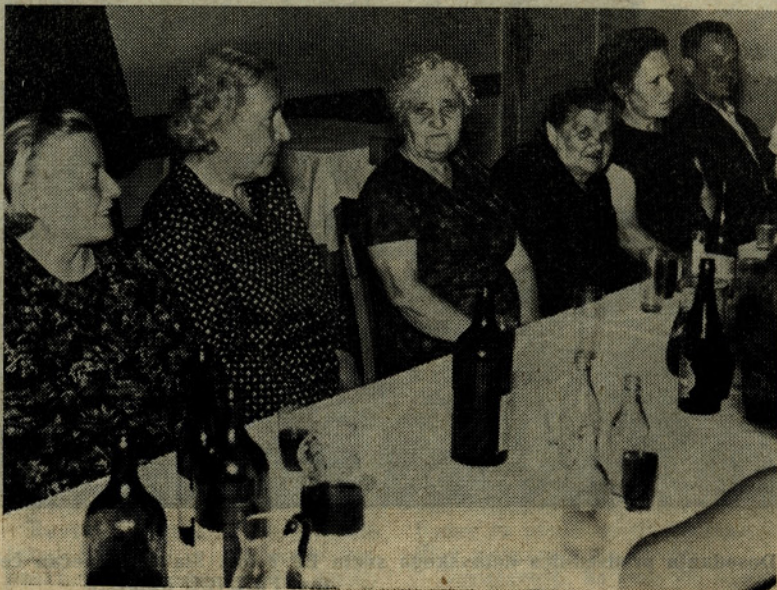
Del udeleženk in udeležencev družabnega večera.

Avstrijsko prebivalstvo uporablja še vedno v pretežni večini lahko emajlirano posodo, pri čemer vrste posode ne odstopajo mnogo ali skoraj nič od našega sortimenta. Delež specialne elektro posode z brušenim dnom znaša danes v Avstriji 15 odstotkov celokupne potrošnje. Na področju kuhinjskih izplakovalnikov hitro napreduje nerjaveča pločevina, tako da se je potrošnja nerjavečih pralnikov že povzpela na 60 odstotkov. Tržišče je preplavljeno s številnimi izvedbami kuhinjskih pralnikov in pomivalnih omaric, pri čemer pralnike kombinirajo z nerjavečimi okvirji, PCV profili, drugimi plastičnimi materiali ter celo s panelnimi ploskvami, ki jih preplepljajo z melaminskimi ploščami. Potrošnja naših plastičnih okvirjev hitro nazaduje. Le redko so pomivalne omarice opremljene s pokrovi za korita.