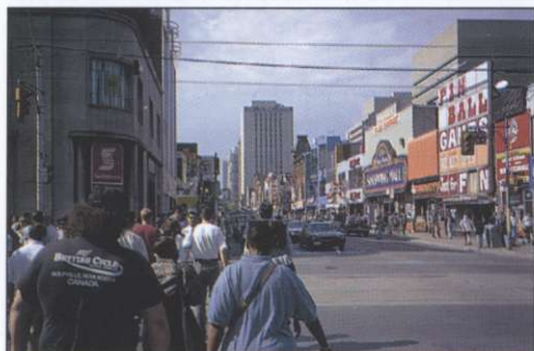
Slika 1: Yonge Street, menda najdaljša ulica na svetu, je skupaj s stranskimi uličicami tudi glavna nakupovalna ulica središča Toronta. Vse od roba mesta do centra vodi pod njo tudi ena izmed prog podzemne železnice.

Te hiše se ne skladajo z okoljem, poleg tega pa so pogosto skoraj prazne. Nekaj let namreč v taki hiši živita le ena ali dve osebi, ki imata običajno dva azijska avtomobila. Po preteku približno petih let se v hišo začno vseljevati novi priseljenci, ponavadi prijatelji ali sorodniki. Končno število stanovalcev se povzpne na okoli 20. Na žalost »pravih« Kanadčanov ni nobene pravne poti za preprečitev gradnje tovrstnih objektov. Posledično se prvot-