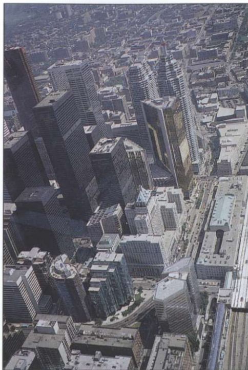
Slika 3: Kot vsako ameriško mesto ima tudi Toronto svoj CBD – central business district – oziroma poslovni center. V njem imajo sedež predvsem banke in najpomembnejša podjetja. CBD Toronto sestavljajo stolpnice borze, First Canadian Plaza, Scotia Plaza, Dominion Centre, Commerce Centre in Bank Plaza.

z igriščem za baseball, in Science Centre oziroma Znanstveno središče.