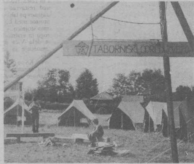
Taborniški odred Zvezda se je predstavil: najmlajši — bodoči pripadniki SLO in akcije Nič nas ne sme presenetiti