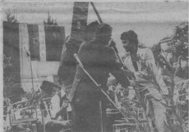
Na proslavi so slovesno razvili prapor ZRVS