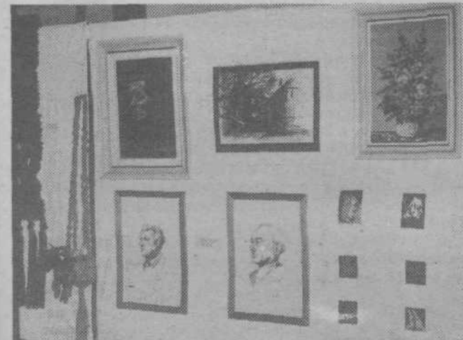
Uspela razstava izdelkov umetnikov amaterjev v osnovni šoli