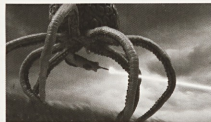
Napad velikanske možgane sesajoče pošasti iz vesolja