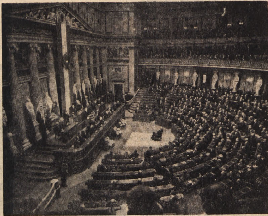
Ob priliki desete obletnice razglasitve Druge republike so se zbrali v Dunajskem parlamentu državni poslanci in zvezni svetniki k skupni seji. Enodušno so demonstrirali za svobodno in neodvisno Avstrijo. Naša slika kaže zasedanje v parlamentu med nagovorom zveznega kanclerja. (AND)

Mi s svoje strani — je rečeno na koncu te resolucije — hočemo zvesti človečanskim idealom miru in bratstva med narodi, za katere smo se borili proti fašizmu, storiti vse, da ti ideali končno obveljajo v odnosih med narodi, na Koroškem konkretno med prebivalci slovenskega in nemškega jezika.