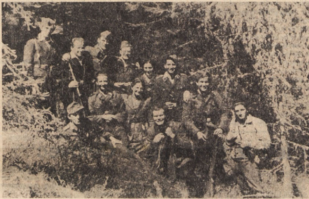
Koroški partizani s Svinške planine