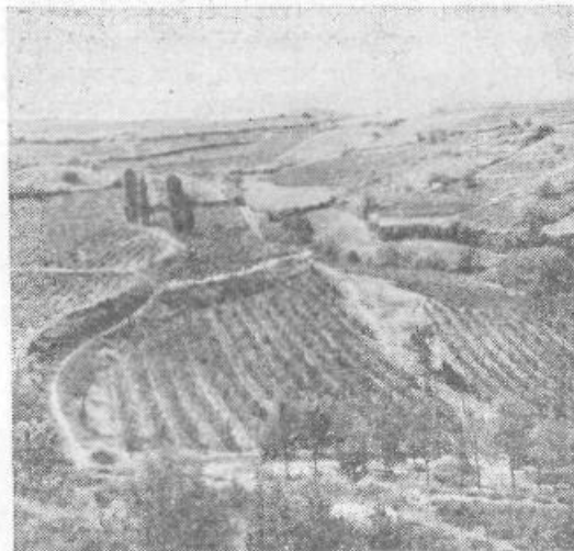
Tikveško kotlino krasijo neskončni vinogradi

• Agrokombinat Tikveš ima najmodernejšo vinsko klet v državi in eno največjih v Evropi. Zelo ugodno podnebje — do 250 sončnih dni v letu in do 500 mm dežja na leto omogoča trgatve do 80.000 ton grozdja, ki ga predelajo v omenjeni kleti, v katero gre 55 milijonov litrov vina, v lesenih, železobetonskih oziroma jeklenih cisternah od 25.000 do 75.000 litrov. Prav v počastitev občinskega praznika je bil odprt novi del kleti z modernimi jeklenimi cisternami za 10 milijonov litrov vina.