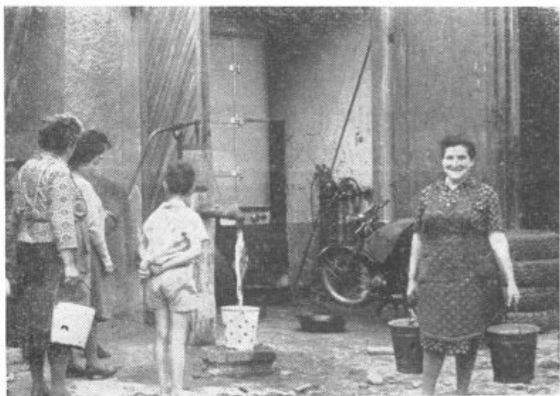
V Lenartu je že stalno pomanjkanje vode, zato so tudi začeli z gradnjo vodovoda. V nekaterih javnih studenih pa tudi ni najboljše voda. Tako pravijo gospodinjje z zgornjega konca Ptujске ceste, da voda ob mehanični delavnici KZ Lenart smrdi po nafti. To bi vsekakor bilo potrebno raziskati s strani sanitarnih organov. (Na sliki: vodnjak ob delavnici —)