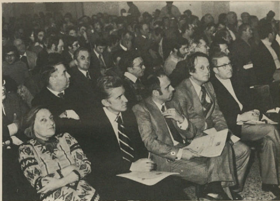
Pogled v kongresno dvorano. V prvi vrsti (desno) delegacija Kraško obalne regije Zveze komunistov Slovenije

Kar zadeva "Delo", glasilo partije v slovenskem jeziku: O njem govorimo že mnogo let ne da bi napravili korak naprej. "Delo" je petnajstdnevnik, toda izhaja neredno. Vrhu tega gre za tistih par straničk, ki ne zadovoljijo nikogar. V naši deželi petnajstnevnikov ni več. Za rešitev tega problema je bistveno finančno vprašanje. Sedaj, ko dobivajo stranke finančno pomoč iz javnih sredstev, bi se morda mogla najti rešitev. Jaz vidim rešitev v mesečni reviji vrste "Confronto", vendar pa da ostane ime "Delo".