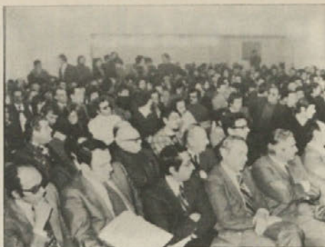
Udeleženci kongresa tržaške federacije KPI. V prvi vrsti: predstavniki strank ustavnega loka

Naizbežno je bilo, da bo to privedlo do pretresov in ostrih sporov na ozemlju, ki je bilo v obdobju tridesetih let prizorišče dveh vojn, nacionalizma, rasizma, šovinizma in imperialističnih manevrov. Jasno je, da je revolucija pozitivno vplivala na razvoj dogodkov v Evropi in v Sredozemlju. Nastala je socialistična Jugo-