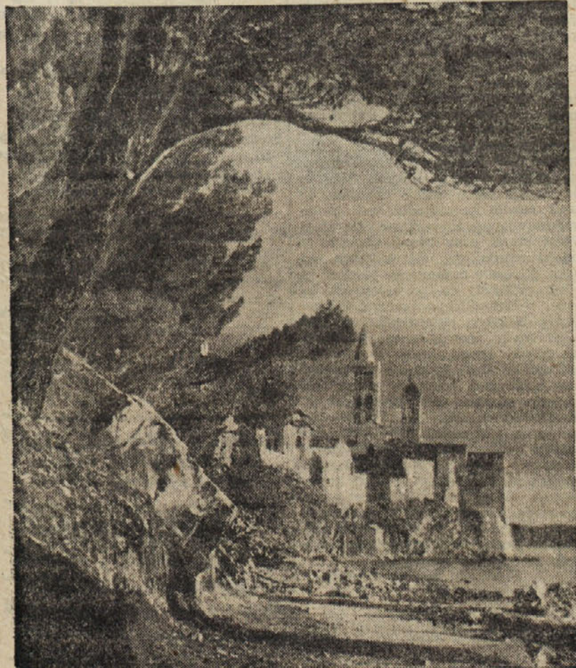
Ali ste že pomislili, kaj boste letos letovali

Skraini čas je že, da se temu stanju napravi konec. Zeleti bi bilo, da bi nogometno moštvo naletelo na potrebno razumevanje tako pri upravi rudnika kakor tudi pri političnih organizacijah. — Več razumevanja, pomoči in priznanja za to vejo športa v Zagorju in lahko smo trdno prepričani, da nas bo nogometno moštvo častno zastopalo v I. slovenski ligi.