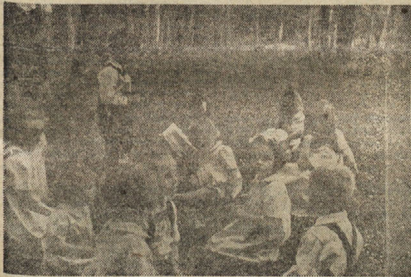
Spomladanski dnevi so privabili naše najmlajše v naravo

Tovariši! Vemo, da je še mnogo dragocenih predmetov med vami, zato ne čakajte. Oddajte te predmete vaši (Nadaljevanje na 6. strani)