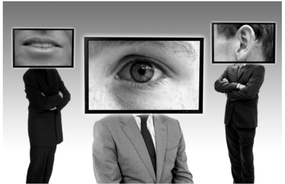
Smo na vrhu ledene gore in čas je, da uživamo v razgledu.

Zdaj se lahko pred poslušalce odpravimo samozavestno. Adrenalin, ki ga čutimo, je normalen in pozitiven. Uporabimo ga, da bo naš govor izžareval energijo. Pred nami je trenutek, na katerega smo se pripravljali dolgo, minil pa bo zelo hitro. Izkoristimo ga. Zavzemimo svoje mesto, bodimo vzravnani, govorimo razločno in se ne obremenjujmo s tem, kakšni smo videti ali kaj si poslušalci mislijo o nas. Ko bomo premostili nekaj težkih začetnih minut in ujeli svoj tok, se bomo sprostili in začeli vzpostavljati zavesten očesni stik s publiko. □