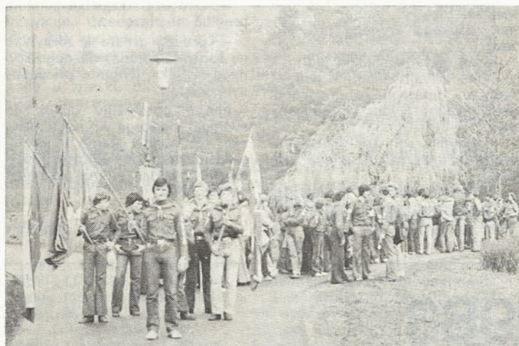
Taborniki na pohodu v Mostje